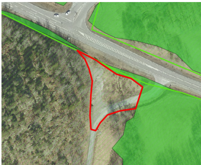
Figur 2. Ett område om knappt 0,2 ha som föreslås utgå ur reservatet.

bakgrund av ovanstående bedömer förvaltningen att det är motiverat att området ska utgå ur naturreservatet.