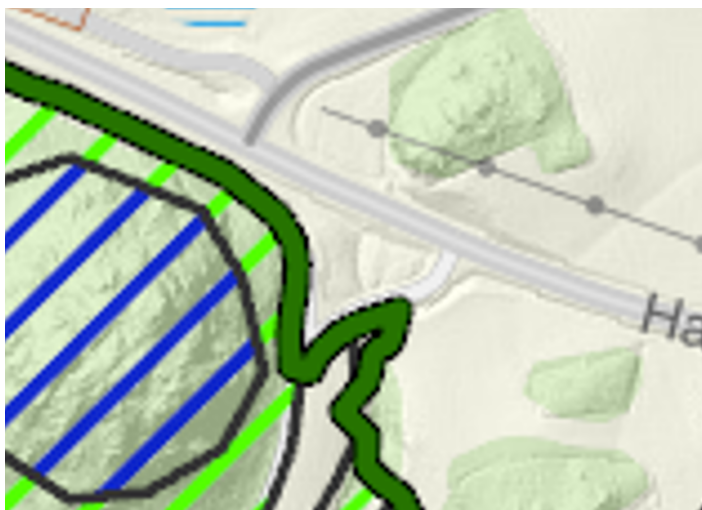
Figur 3. Ny gräns för avsett område

Huddinge kommun bedömer att ett genomförande av vägplanen för Väg 259 Tvärförbindelse Södertörn utgör synnerliga skäl enligt 7 kap. 7 § miljöbalken för att ändra gränsen för de delar av Paradisets naturreservat som påverkas av Tvärförbindelse Södertörn.