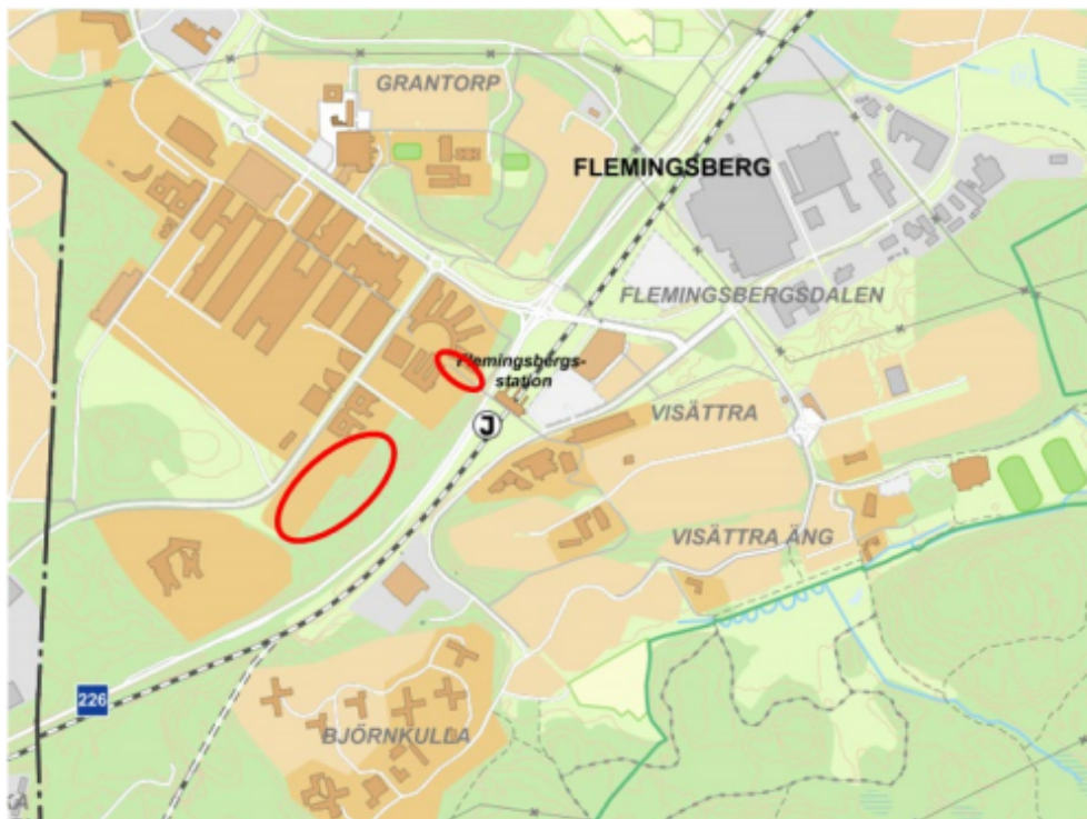
Planområdets ungefärliga läge inom Flemingsberg

Laga kraft Kvartal 2, 2021 Byggnation 2021 – 2025