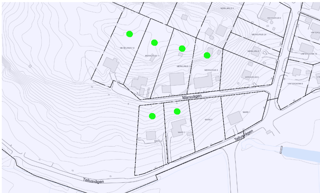
Bild 3. Bild där de sex fastigheter som kommer att beröras markerats med grön punkt.

I samband med det arbetet med detaljplanerna och vägplanen har konstaterats att fastigheterna (se bild 3 nedan) på grund av den framtida bullersituationen kommer få sådana bullernivåer att de inte kommer kunna bo kvar på platsen.