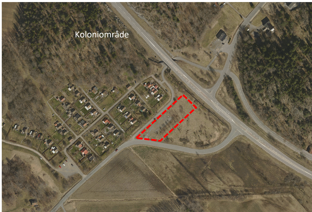
Figur 1: Flygfoto över berört område. Upphävandets ungefärliga avgränsning markerat i rött.

Syftet med att upphäva den gällande detaljplanen för Ekedal II är att möjliggöra för Trafikverkets vägplan för Tvärförbindelse Södertörn. För att Trafikverket ska kunna fastställa vägplanen krävs det att vägplanen inte strider mot gällande detaljplaner.