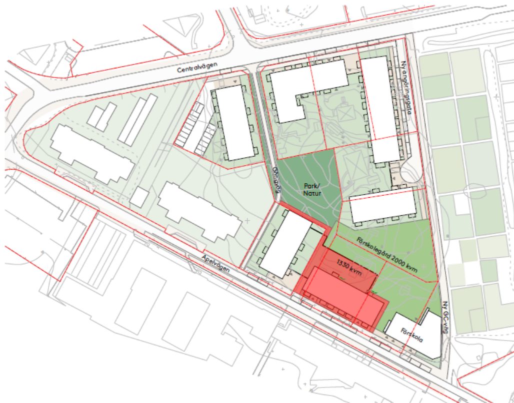
Illustrationsplan, föreslagen bebyggelsestruktur. ÅWL, JM