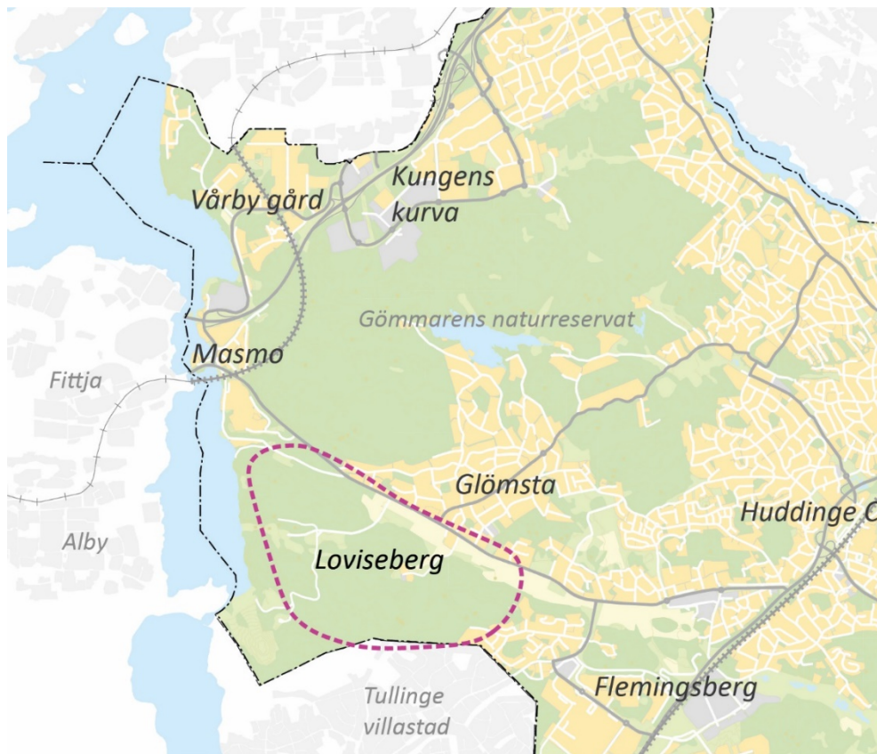
Figur 1: Ungefärligt programområde