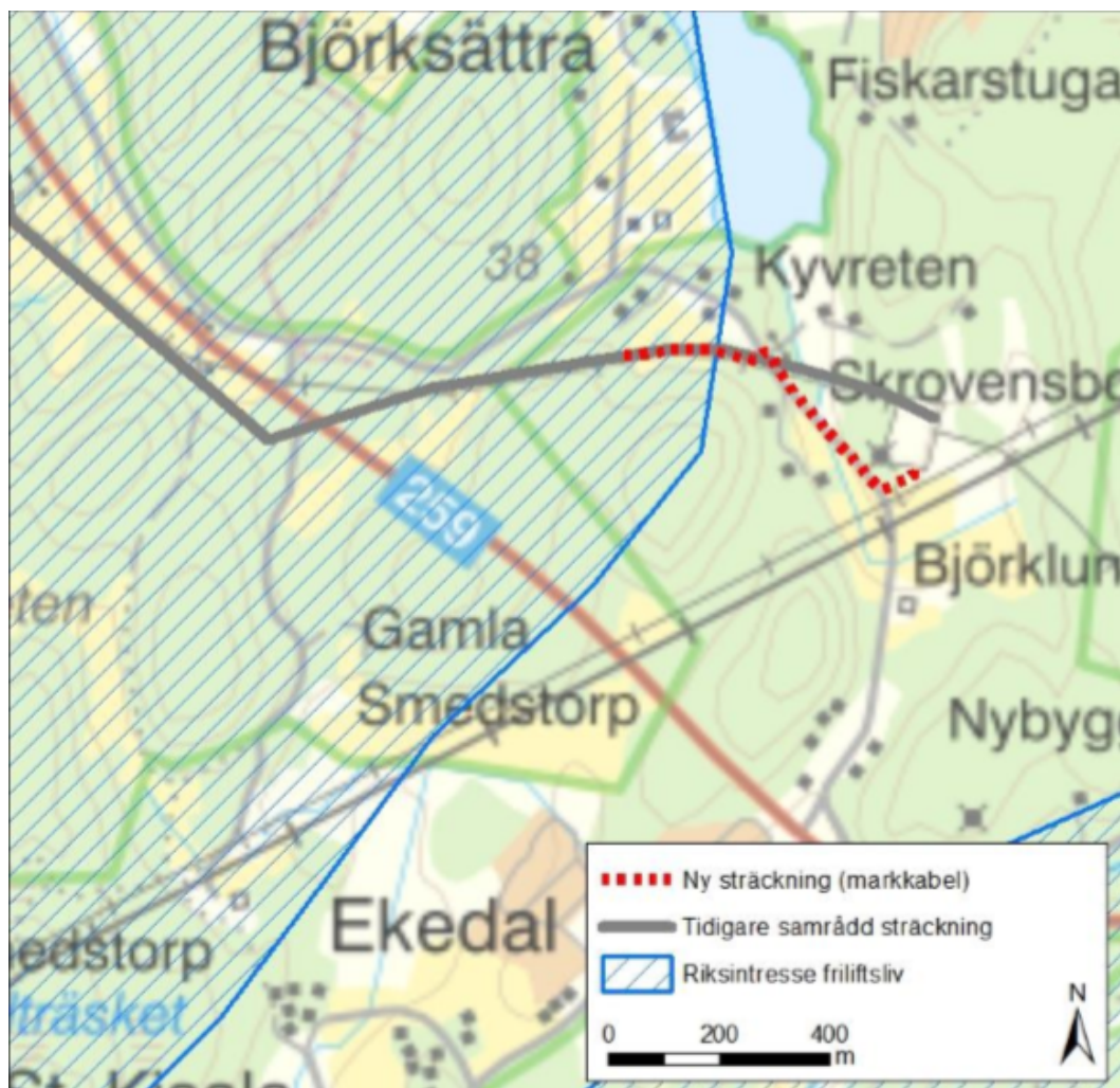
Figur 2. Ny ledningssträckning in till Lissma station

Den nya ledningssträckningen som föreslås av Vattenfall Eldistribution AB innebär att markförlägga kraftledningen den sista sträckan in mot Lissma station. Den exakta punkten för övergång mellan luftledning och markförlagd kabel är inte klar men Vattenfall Eldistribution AB för diskussioner kring detta med berörd markägare.