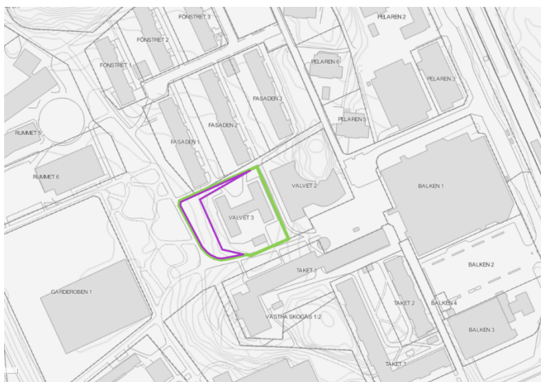
Figur 2 Preliminärt planområde är markerad med grön begränsningslinje. Kommunens del är markerad med lila begränsningslinje

Planområdet består av fastigheten Valvet 3 som ägs av Huga Bostäder AB, markerad med grönt i Figur 2 nedan, samt del av den kommunägda fastigheten Västra Skogås 1:2, markerad med lila i Figur 2 nedan. Totalt beräknas planområdet till ca 3 900 m 2 varav 2 858 m 2 är från Valvet 3 och 1 042 m 2 är från Västra Skogås 1:2. Det innebär att ca en fjärdedel av planområdet består av fastigheter som idag ägs av kommunen.