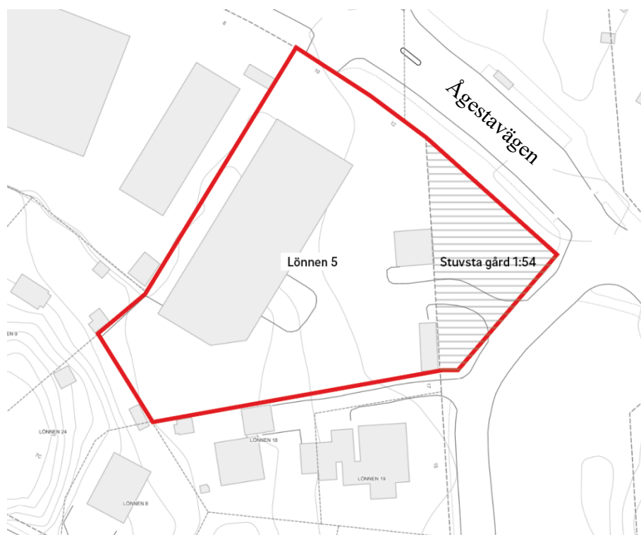
Figur 2. Preliminär avgränsning för planområde markerat i rött.

Planområdets areal uppgår till cirka 3 740 kvadratmeter och omfattar fastigheten Lönnen 5 och en mindre del av fastigheten Stuvsta gård 1:54. Planområdet är beläget med närhet till handel och offentlig service samt har bra linjeförbindelser med buss och ett avstånd om cirka 1 200 meter till Stuvsta station.