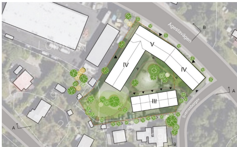
Figur 3. Situationsplan, bebyggelseförslag. Arkitema.

Under planarbetet kommer bland annat grundläggningsförhållandena, buller, marföroreningar samt dagvatten och skyfall att utredas vilket kan komma att påverka byggnadernas slutgiltiga placering.