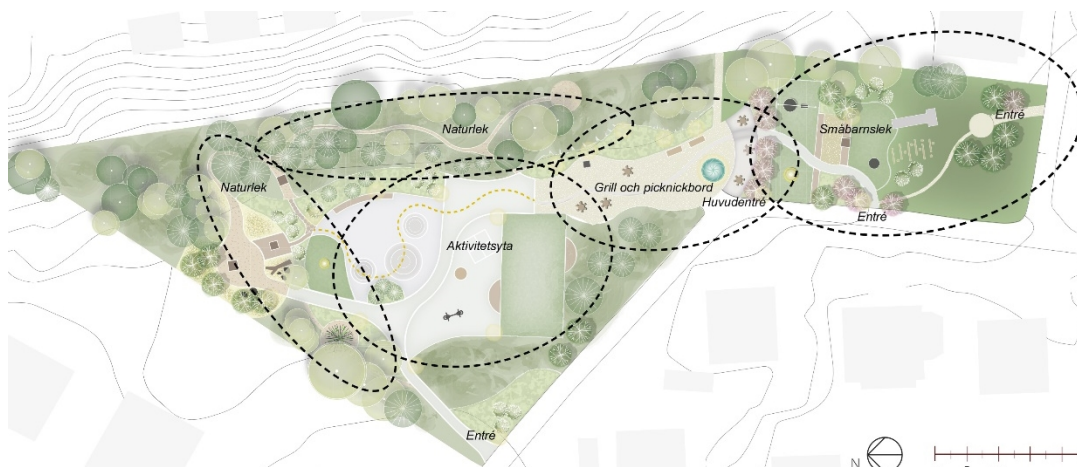
Förslagsskiss för ny utformning

Lekplatsen planeras att få fler aktiviteter och nya lekmöjligheter. I förslaget erbjuder parken både naturlek och en stor aktivitetsyta med bland annat en multisportyta, basket, kullar på asfalt och sittmöbler. Huvudentrén blir en samlingsplats med hammockar, grill och picknickbord. Där finns också lek för de yngsta barnen med gungor, studsatta, snurrlek, en större sandlåda med lekhus, och i slänten en rutschkana och lekfulla trappsteg.