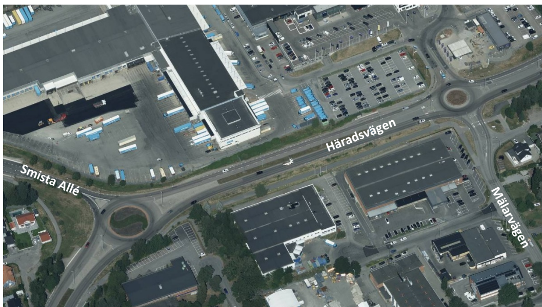
Översikt över Häradsvägen mellan Mälarvägen och Smista Allé.

Bullernivåerna på Häradsvägen är relativt höga, och skapas främst av den trafik som finns på Häradsvägen. Buller skapade av E4/E20 kan upplevas, men går inte effektivt att skärma av med hjälp av en trädallé på Häradsvägen. Detta för att allén ligger för långt bort från källan.