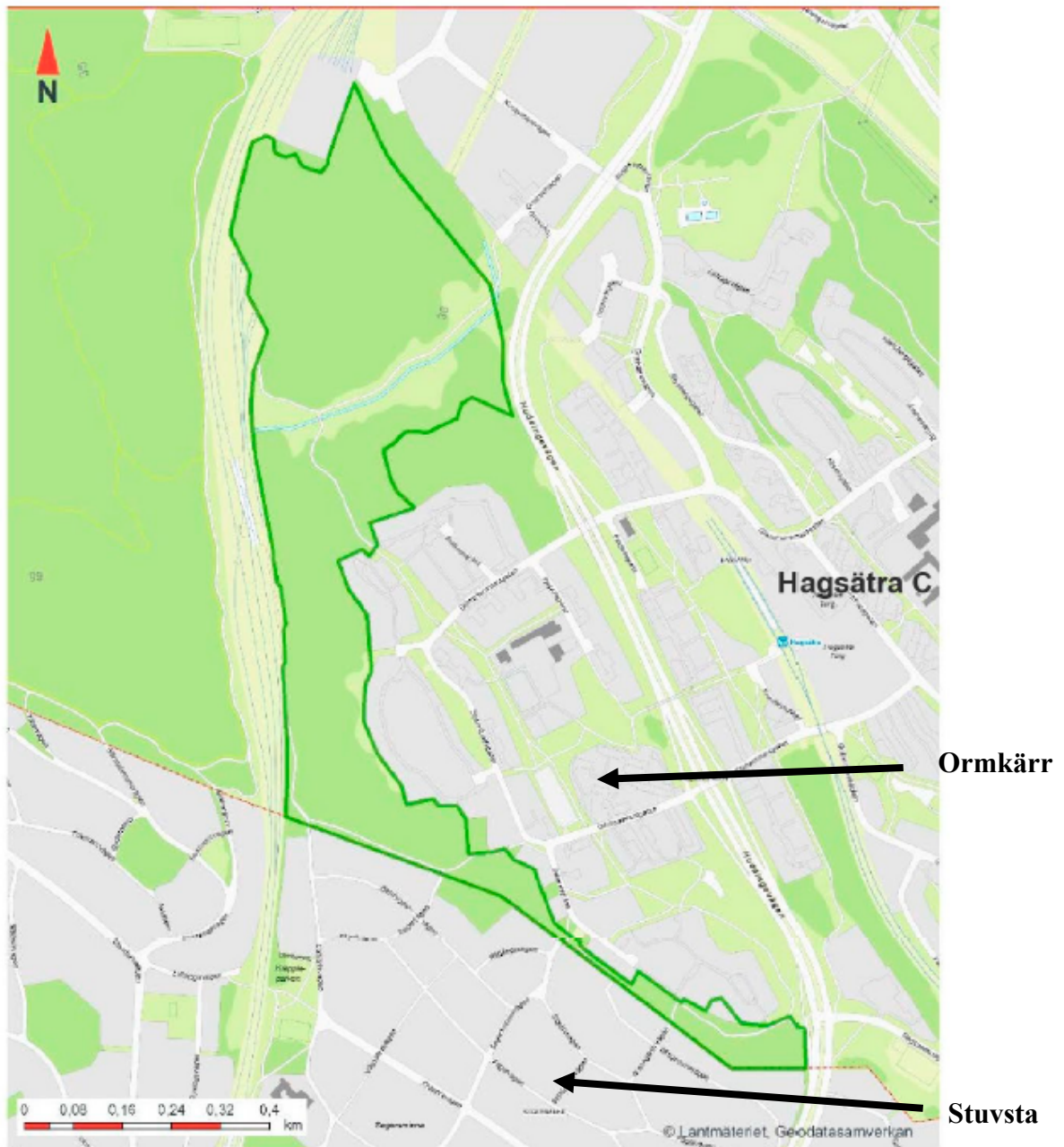
Figur 1. Föreslagen reservatsgräns markerad med grön linje.

Områdets värden och reservatsföreskrifter framgår närmare av bifogat beslutsdokument, beslutskarta och skötsel­föreskrifter, se bilaga 3.