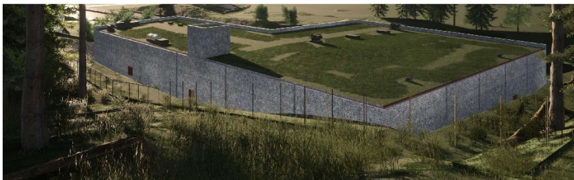
Figur 2: Illustration från Trafikverkets gestaltungsprogram

Byggnaderna placeras på en sprängd plåtå som omgivs av berg och vegetation. Gestaltningen av de tekniska anläggningarna ska anpassa sig till den omgivande naturen. Materialval ska vara tegel, trä eller sten. Färgsättningen av fasaden behöver följa naturens färger, varför kulörer som liknar skog och berg bör väljas. Vidare planeras byggnaden att uppföras med ett platt tak. Det platta taket planeras att följa den omgivande naturens vågräta linjer. Taket ska uppföras med vegetation för att byggnaden ytterligare ska inordnas i naturen.