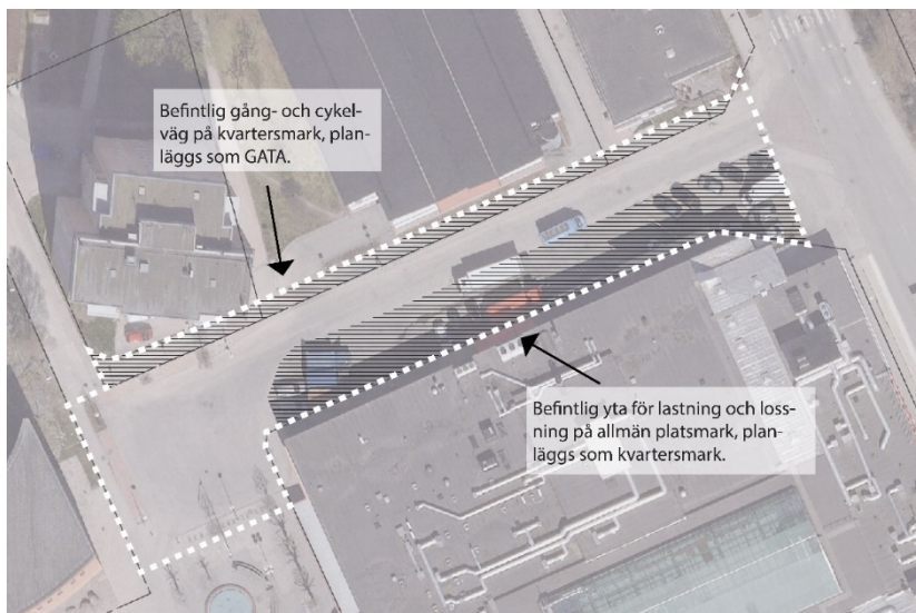
Bild över planerad markreglering.

Planförslaget innebär ingen ny byggrätt utan säkerställer att lossning och lastning samt avfallshantering för verksamheterna i Skogås centrum sker på kvartersmark och inte allmän platsmark. Kvartersmarken kommer bestå av prickmark och ingen ny byggnation kommer komma till. Detaljplanen säkerställer också att befintlig gång- och cykelväg längs med Skogås Torgväg blir allmänt tillgänglig genom att planläggas som GATA.