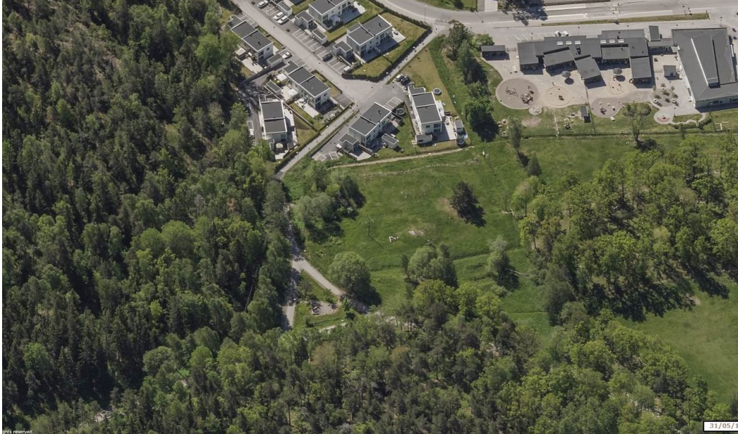
Plats 1. Glömsta/Källbrink