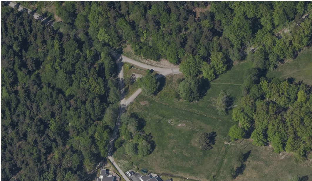
Plats 1. Glömsta/Källbrink