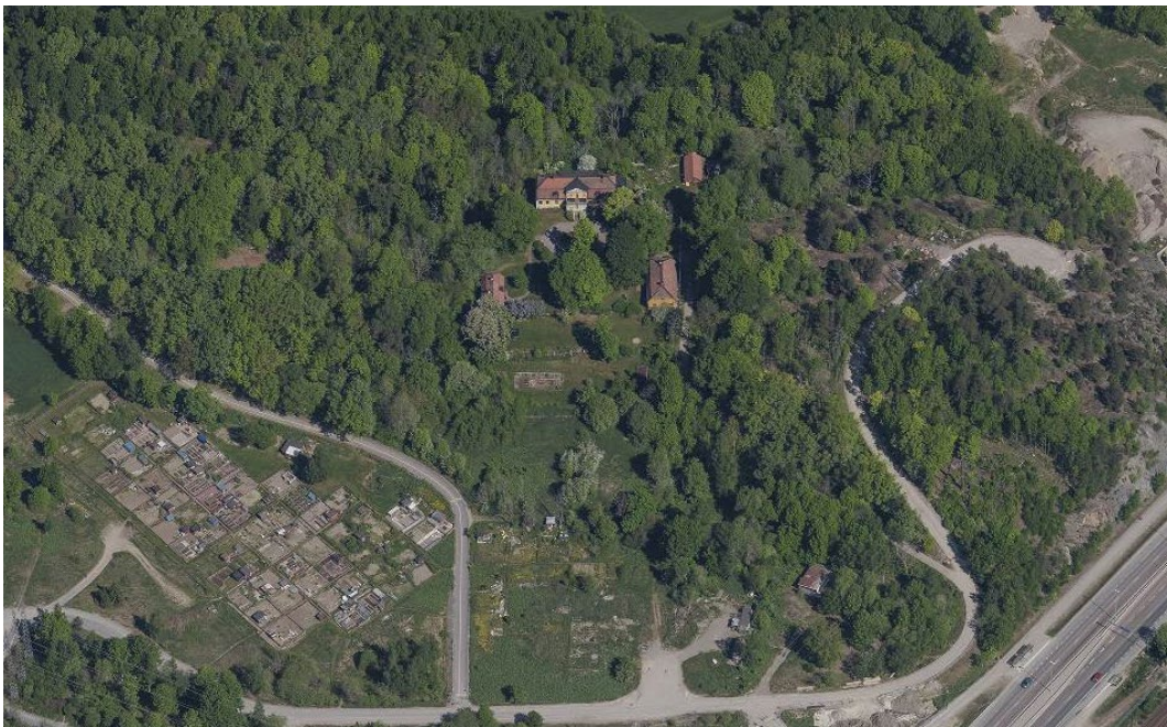
Plats 2. Flemingsbergs gård