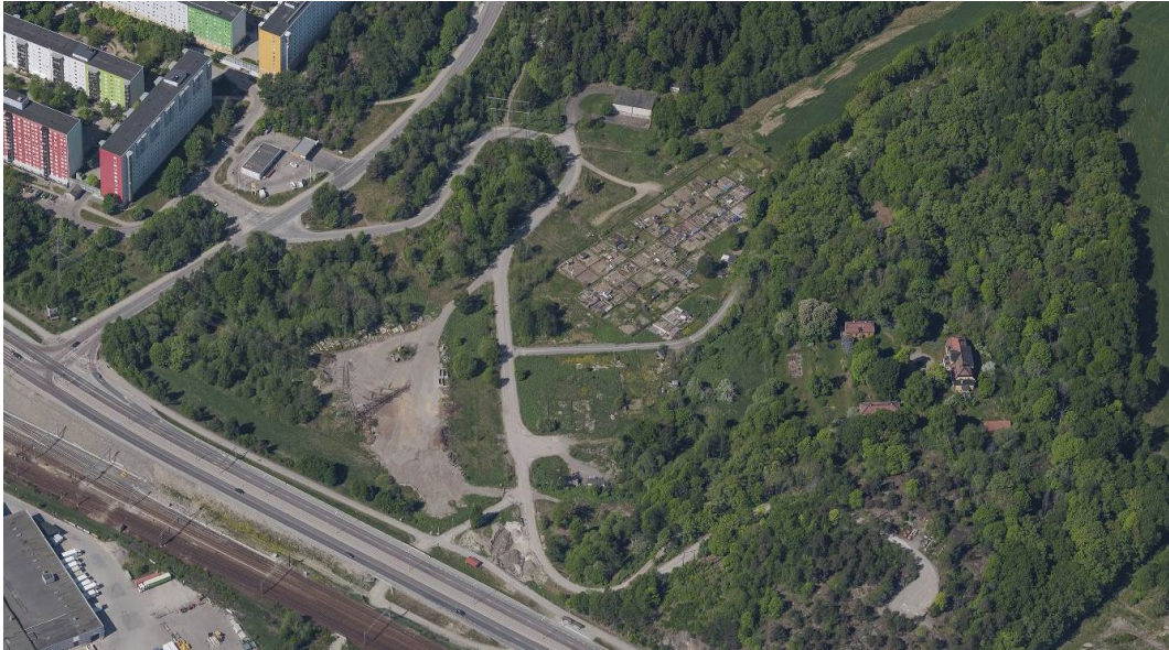
Plats 2. Flemingsbergs gård