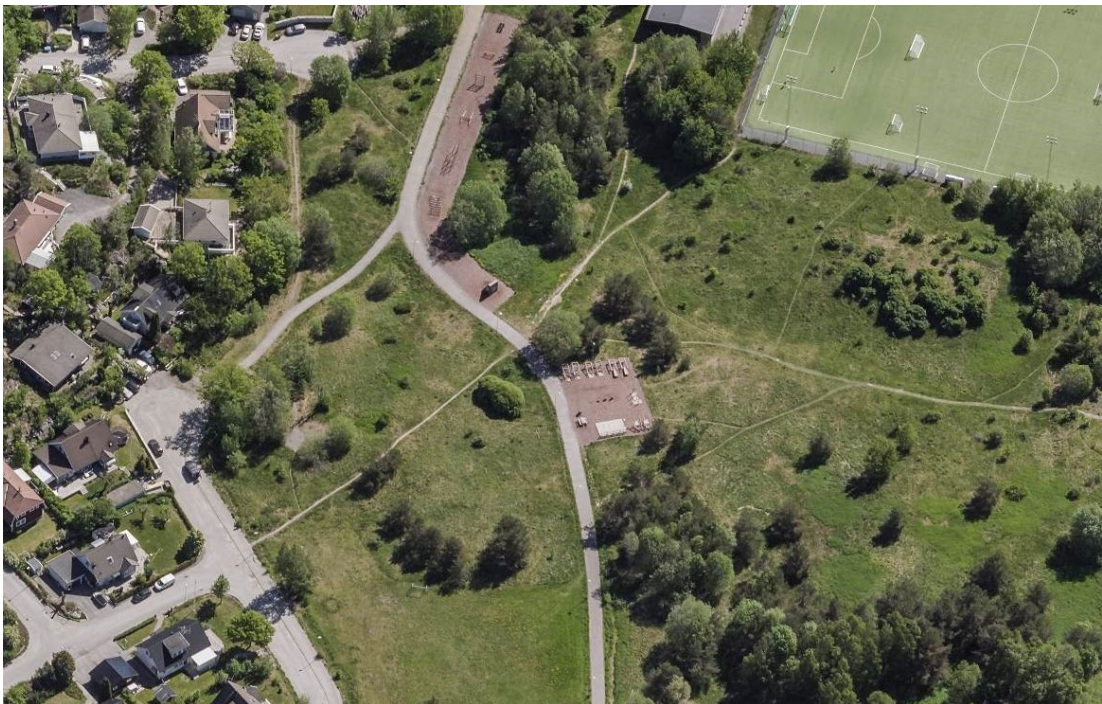
Plats 3. Nytorps mosse