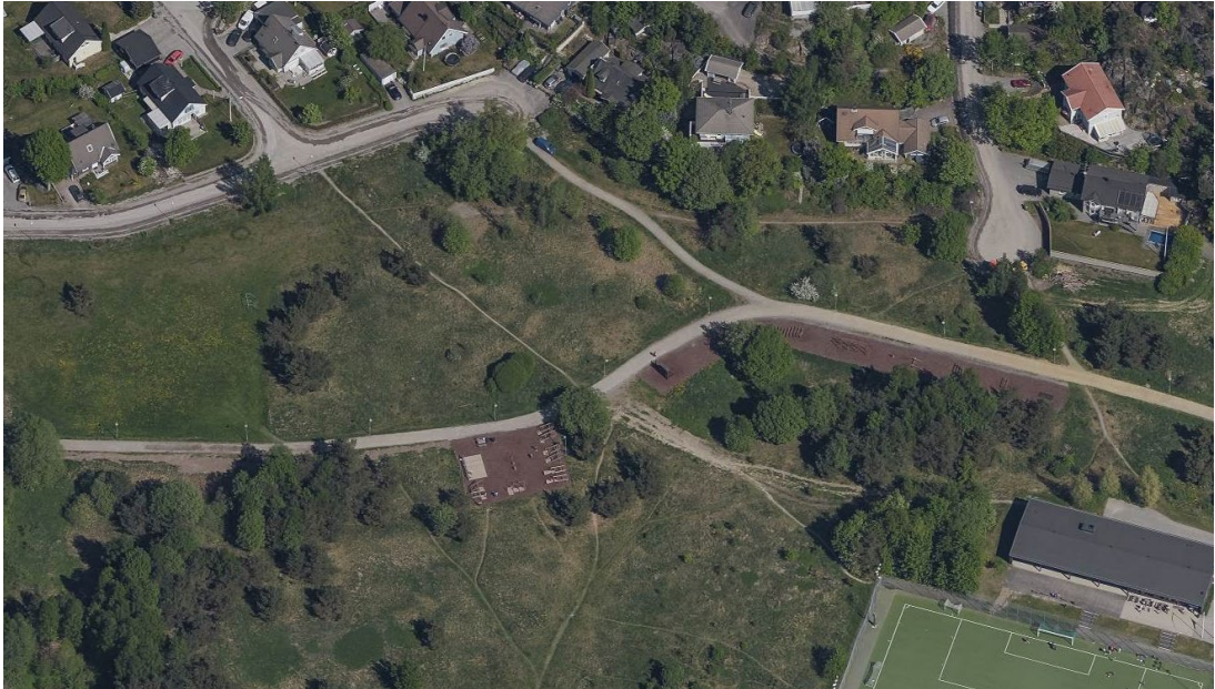
Plats 3. Nytorps mosse