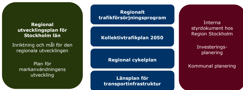
Figur 2. Regionala utvecklingsplanen för Stockholms län är utgångspunkter för den strategiska planeringen gällande kollektivtrafik och cykel samt för länsplanen för transportinfrastruktur i regionen.

Det finns ett antal strategiska besluts- och planeringsunderlag som möjliggör planering, prioritering och genomförande av åtgärder för hållbara resor i regionen. Gemensamt för dessa underlag är att de har tagits fram i samverkan med regionala aktörer.