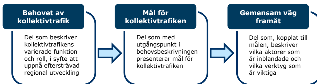
Figur 1. Programmets tre övergripande delar.

Programmet är i huvudsak uppdelat i tre övergripande delar.