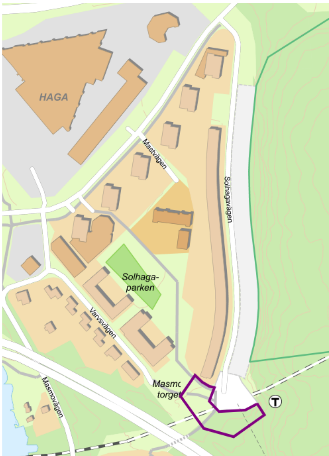
Bilaga 3, Överlåtelseområdets preliminära avgränsning