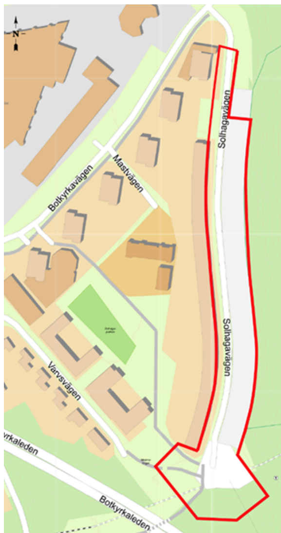
Bilaga 1, Planområdets preliminära avgränsning