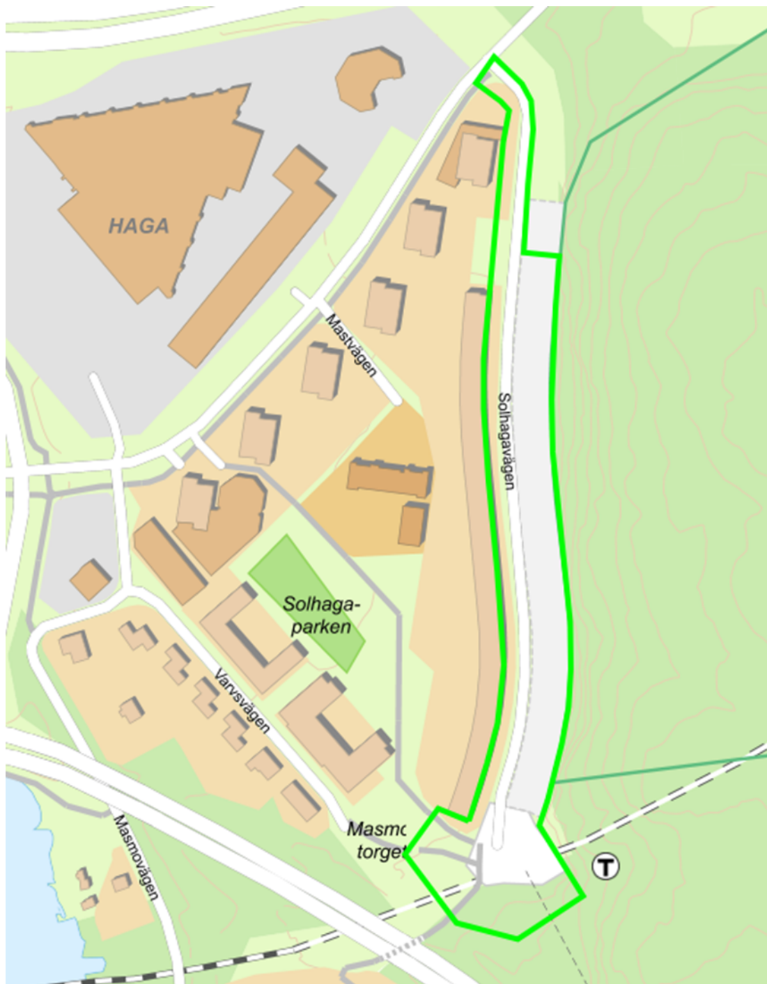
Bilaga 2, Exploateringsområdets preliminära avgränsning