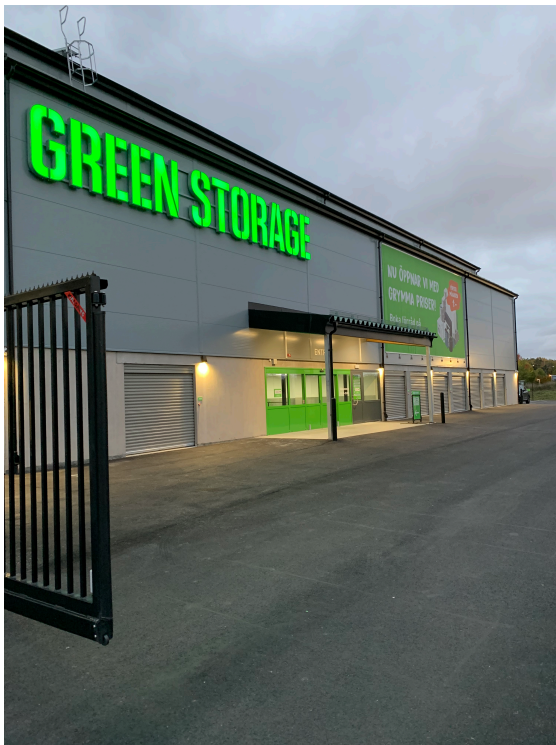
Exempel på fastighetens gestaltning

Lagerbyggnaden består av plåtfasader med gröna metallpartier, tak av svart papp samt fasadetaljer av svart plåt. Områdesskydd av svart staket med automatiska grindar.