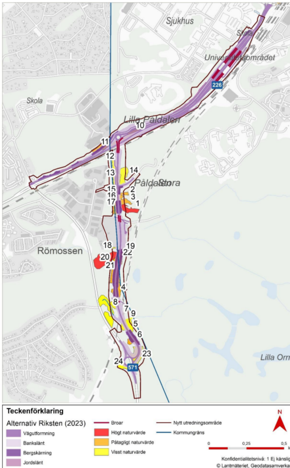
Figur 4. Kartan visar hela det nya utredningsområdet. Naturvärdesobjekten är numrerade på samma sätt som i samrådsunderlaget.