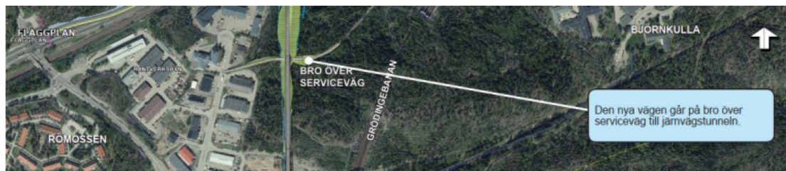
Figur 2. Urklipp från MKB tillhörande lagakraftvunnen vägplan.

Enligt Trafikverkets bedömning kommer trafikbuller för boende i Römossen, om porten anläggs, blir desamma som i lagakraftvunnen vägplan.