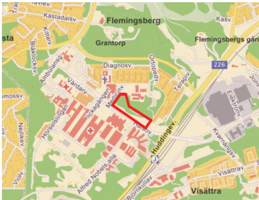
Figur 1- Översiktskarta, planområde markerat.

Planområdet ligger längs Hälsovägens norra sida i Flemingsberg, se figur 1.