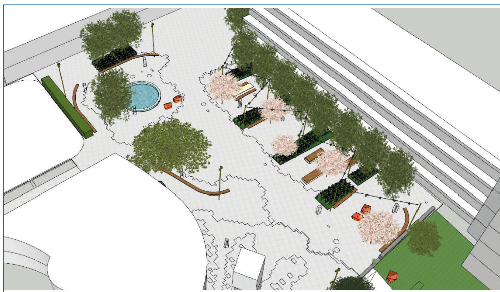
Bild 4. Visualisering av förslaget

Skogåstorget har möjligheter att bli en viktig och framförallt omtyckt mötesplats i området. Projektet bedöms prioriterat då det finns behov av trygghetsskapande åtgärder i området. Förslaget innebär en stor satsning på belysningsåtgärder för att torget ska upplevas som tryggare och få mysigare karaktär. Olika rumskapande åtgärder planeras för att omöjliggöra den biltrafik idag som går över torget. Förvaltningen gör bedömningen att förslaget till upprustning innebär att fler olika åldersgrupper kommer att kunna använda torget. Detta medför i sin tur att platsens attraktivitet ökar.