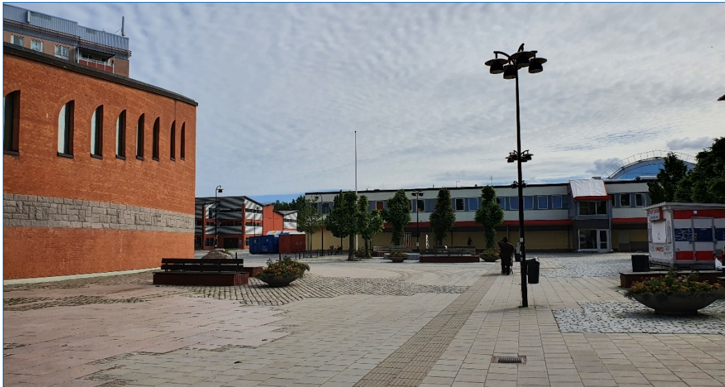
Bild 2. Skogåstorget idag.

Skogåstorget i Skogås centrum är i behov av utveckling och upprustning. Centrumbyggnaden, kyrkan och ett bostadshus bildar tre väggar kring torget. Torget upplevs idag som ödsligt och otryggt trots att många människor passerar där. Det finns stora möjligheter att få fler att stanna till om torget vore trevligt och ombonat.