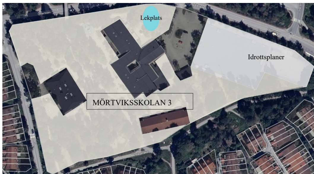
Figur 3: Mörtviksskolans tomtgräns. Den markerade ytan visar skolgården.

Bullerutredningen visar att mer än 50% av skolgården ligger under 50 dBA ljudnivå, vilket är i linje med riktvärden från Naturvårdsverket. Däremot ligger värdena vid ytterkanten av lekplatsen närmast Österleden över 55 dBA ljudnivå, vilket inte är i linje med Naturvårdsverkets riktvärden. Denna yta är av begränsad utbredning. Det skulle eventuellt vara möjligt att disponera om skolgården något för att lägga barnens vistelsezoner för den mest störningskänsliga verksamheten på områden med lägre ljudnivå.