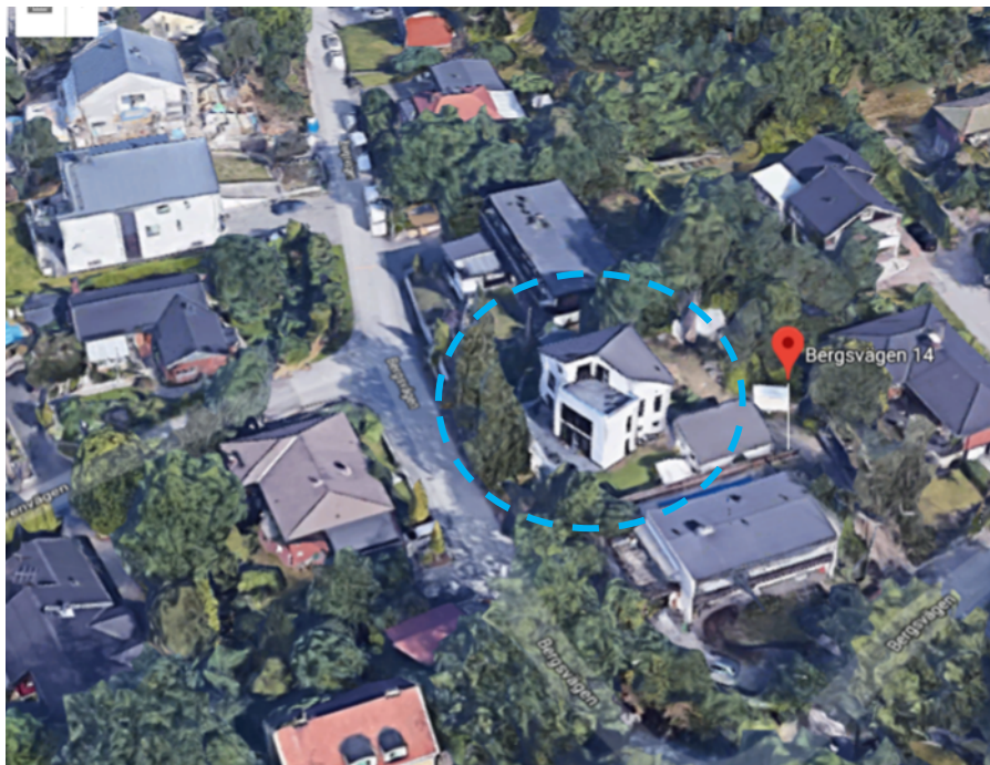
Flygfoto på huset, aktuell byggnad markerad med streckad ring

I ärendet om vitesutdömande gav mark- och miljööverdomstolen den 3 januari 2022 prövningstillstånd samt upphävde Mark- och miljödomstolens beslut från den 11 december 2020 om förplikandet att betala vitet och avslag också nämndens ansökan om utdömande av vite.