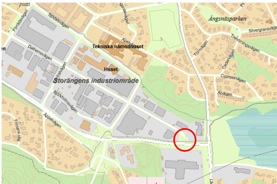
Bild 2 Översiktskarta med den nya in- och utfarten i Dalhemsvägens förlängning mot Storängsleden, markerad med röd cirkel

För att öka tillgängligheten till Storängen behöver en ny in- och utfart byggas vid Dalhemsvägen/Storängsleden, se bild 2. Den nya in- och utfarten ger förutsättningar för en bättre bygglogistik i samband med den fortsatta utbyggnaden i Storängen, förbättrar trafikflödet till de befintliga industriverksamheterna samt för att kunna tillåta tung trafik med farligt gods att angöra området på ett bättre sätt och inte störa de nya bostäderna.