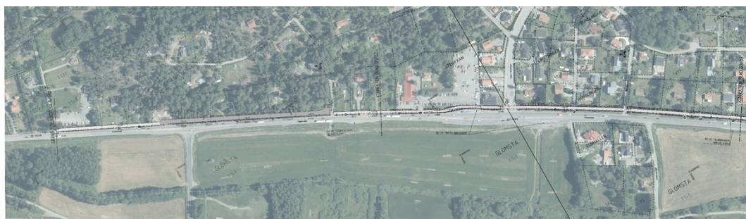
Figur 3: Illustration över gång- och cykelvägens västra halva. Från Trafikverkets samrådshandlingar. Förändringar i Trafikverkets vägplan har skett.

Gång- och cykelvägen ansluts mot befintlig gång- och cykelväg vid Bergavägen (som breddas inom projekt Tvärförbindelse Södertörn) och ansluter till den planerade gång- och cykelvägen vid Björkhagsvägen (där ny gång- och cykelväg byggs västerut inom projekt Tvärförbindelse Södertörn). Trafikverket planerar att uppföra en skiljeremsa mellan Glömstavägen och gång- och cykelvägen. Trafikverket kommer också se över passager över Glömstavägen och förändra placering och trafiksäkerheten vid vissa av Glömstavägens busshållplatser.