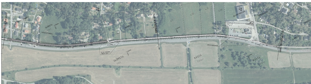
Figur 4: Illustration över gång- och cykelvägens östra halva. Från Trafikverkets samrådshandlingar. Förändringar i Trafikverkets vägplan har skett.