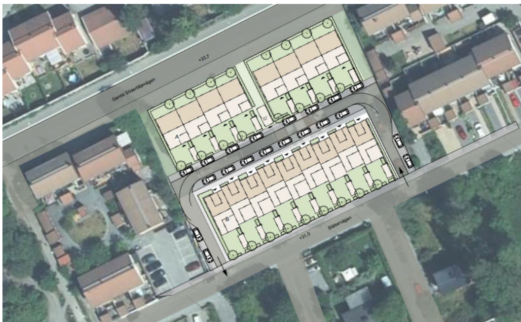
Bild 3. Föreslagen bebyggelse inom fastigheterna Godsägaren 2 och 3. Bild från planbeskedsansökan.