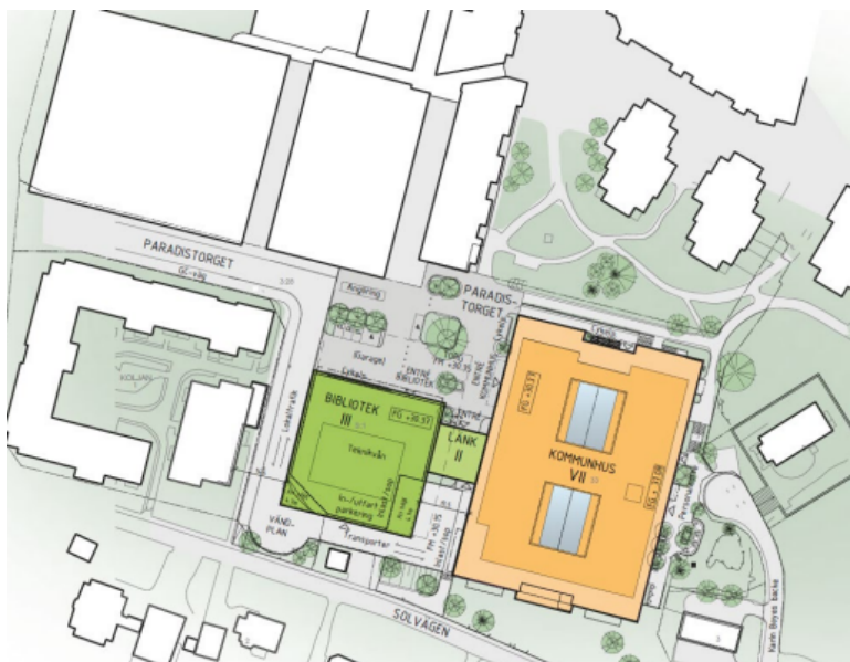
Situationsplan, nytt huvudbibliotek och kommunhus (White Arkitekter)

Det nya Paradistorget blir en plats för vistelse och ett uterum som kopplar samman bibliotekets och kommunhusets huvudentréer. Här föreslås sittplatser och cykelparkering inkladade i befintlig trädrad. Hela torgytan föreslås utformas som gångfartsområde på fotgängares villkor. Den fysiska och visuella kopplingen mellan Paradistorget och Sjäodalstorget bedöms förstärkas i och med detaljplanens genomförande. Både påbyggnaden på befintlig byggnad och den nya biblioteksbyggnaden föreslås uppföras med stomme av trä och med trä och glas i fasad för att ge ett öppet uttryck och som kontrast till de i övrigt slutna fasaderna på platsen. Att använda trä är också i linje med kommunens miljö- och klimatmål.