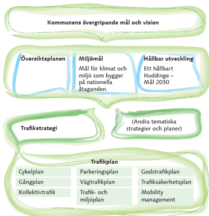
Figur 1: Schematisk bild över dokumenthierarkin för trafikstrategin och dess åtgärdsplaner.

pekar på inriktningar och identifierar insatsområden för att uppnå kommunens målbild om effektiva, tillförlitliga och hållbara godstransporter. För att uppnå detta måste kommunen arbeta aktivt, långsiktigt och systematiskt med dessa frågor där insatser krävs inom en rad områden.