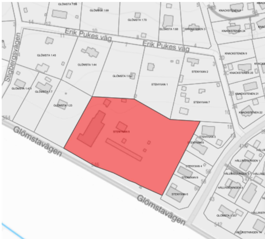
Bild 1. Fastigheten Stenyxan 5 markerad.