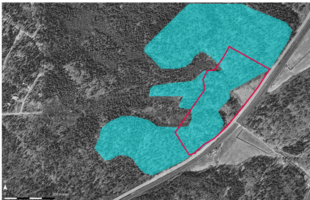
Figur 2. Kartan visar hur undersökningsområdet (inom röd avgränsning) och intilliggande område såg ut på 1960-talet.

På ortofoton från 1975 har stora delar av hållmarkerna i den nordvästra delen sprängts bort i samband med byggandet av sjukhuset.