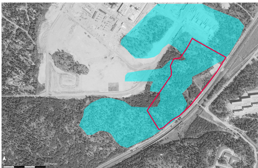
Figur 3. Kartan visar hur undersökningsområdet (inom röd avgränsning) och intilliggande område såg ut 1975. Stor del av den nordvästra delen av hållmarken har sprängts bort.