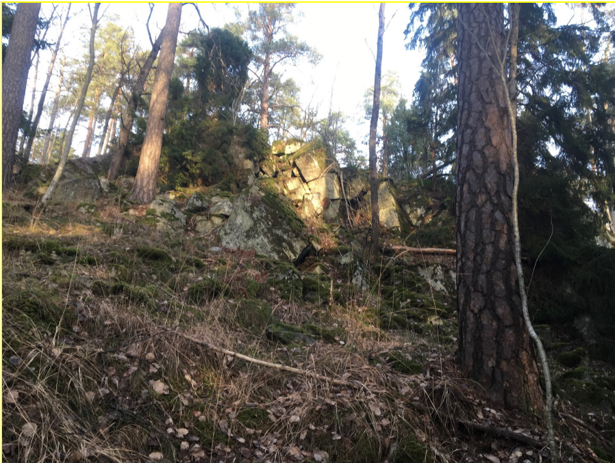
Delområde 1. Berg och rasbrant med tät skog