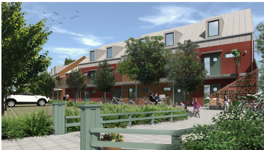
Visionsbild över den nya bebyggelsen.