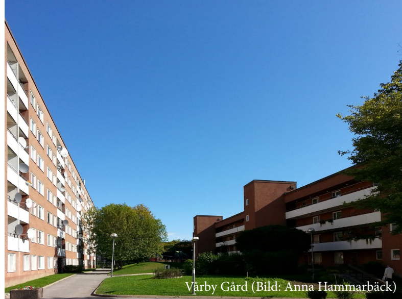
Vårby Gård