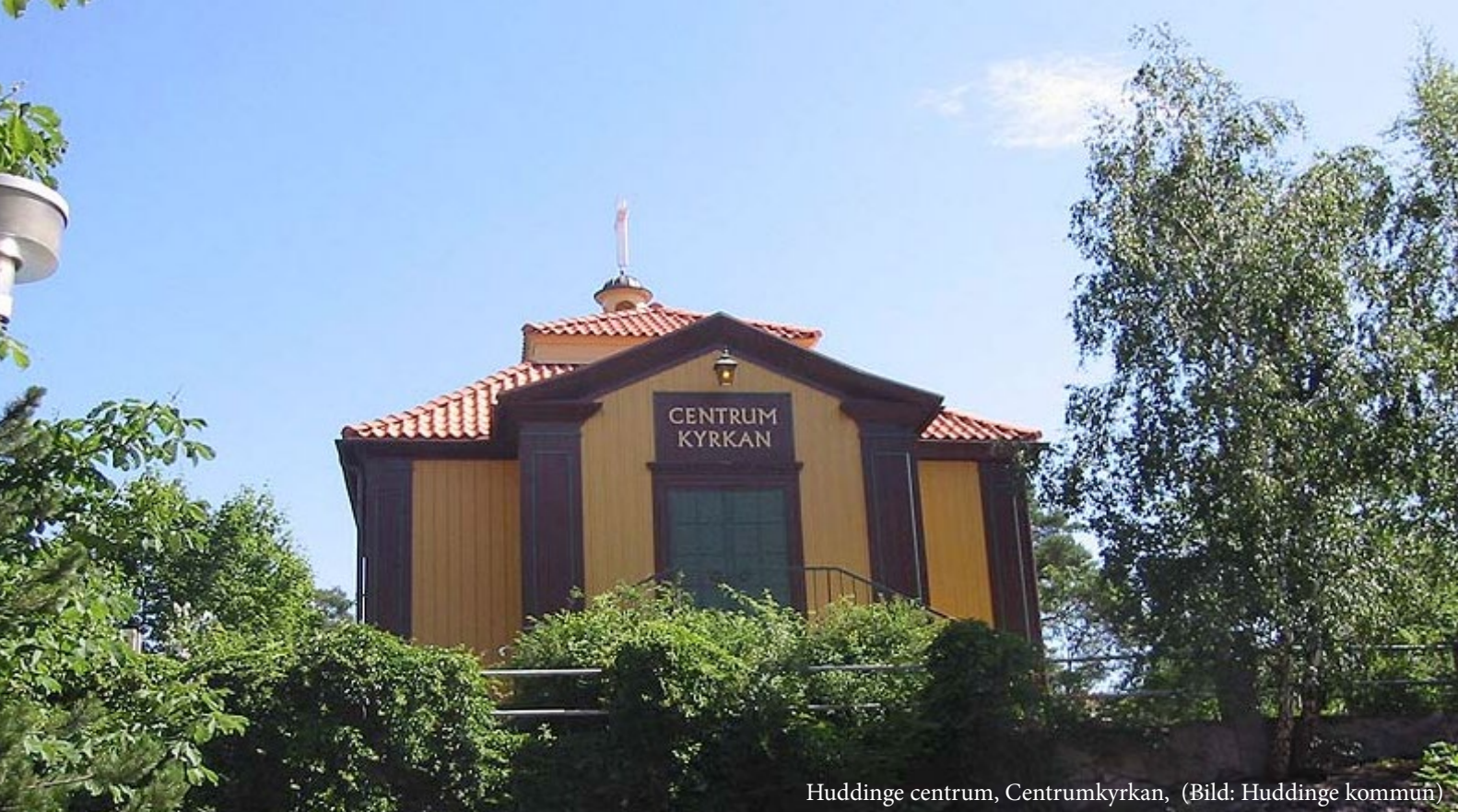
Huddinge centrum, Centrumkyrkan, (Bild: Huddinge kommun)