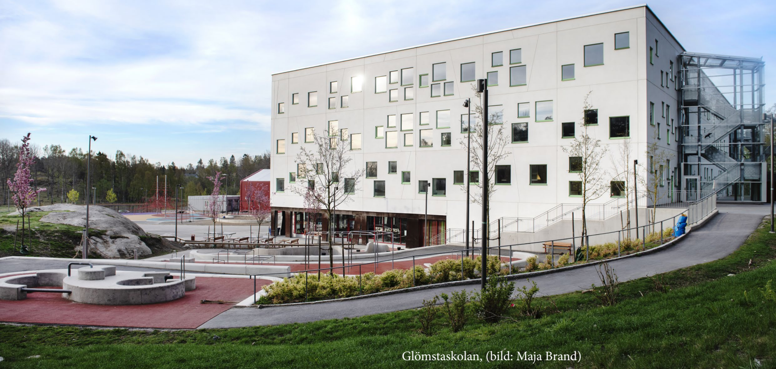
Glömstaskolan, (bild: Maja Brand)