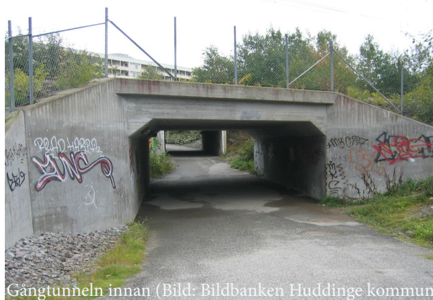
Gångtunneln innan

Uppsikt kring stråk skapas genom att belysa omgivningar och ta bort eller glesa ut kringliggande vegetation.