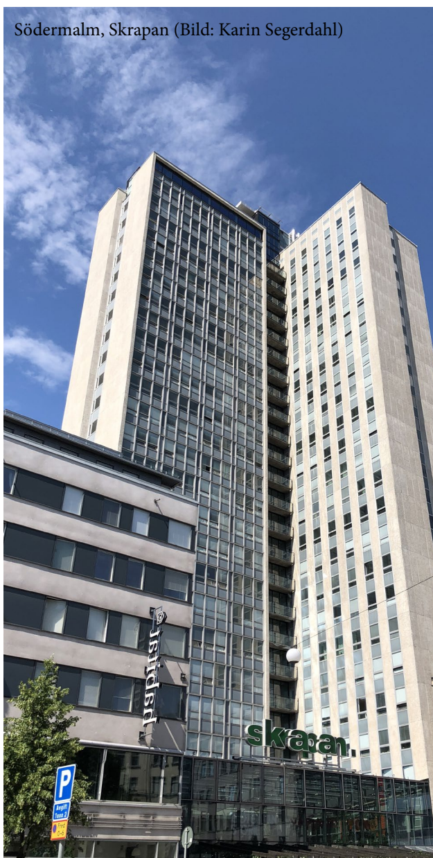
Södermalm, Skrapan

Högt exploaterad bebyggelse medför ofta effektivt markutnyttjande, korta transportvägar och bra underlag för kollektivtrafik. Det skapar också förutsättningar för gemensamma lösningar för fjärrvärme, avfallshantering, mobility management-åtgärder med mera. Samtidigt anar vi en bortre gräns då exploateringen blir för hög och inte längre hållbar på grund av att det saknas tillräckliga ytor för växtlighet, rekreation och utevistelse. Det märks till exempel på slitage av grönytor. Allt för hög exploatering kan innebära alltför mörka ytor både inne och ute och nödvändiga funktioner riskerar att inte få plats.