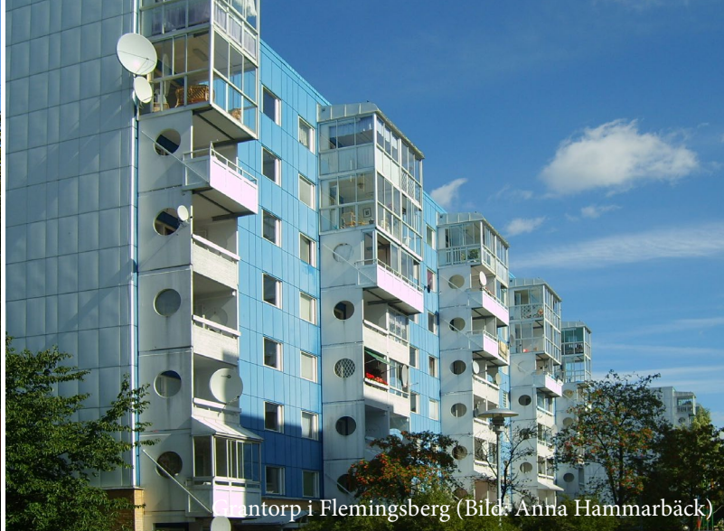
Intorp i Flemingsberg