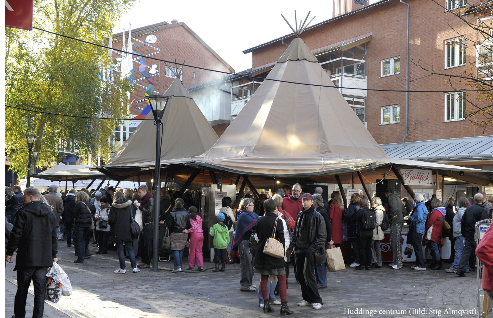
Huddinge centrum