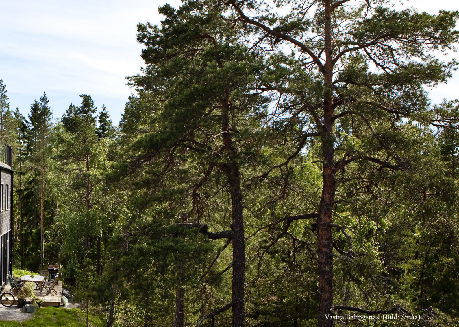
Västra Balingsnäs, (Bild: Småa)