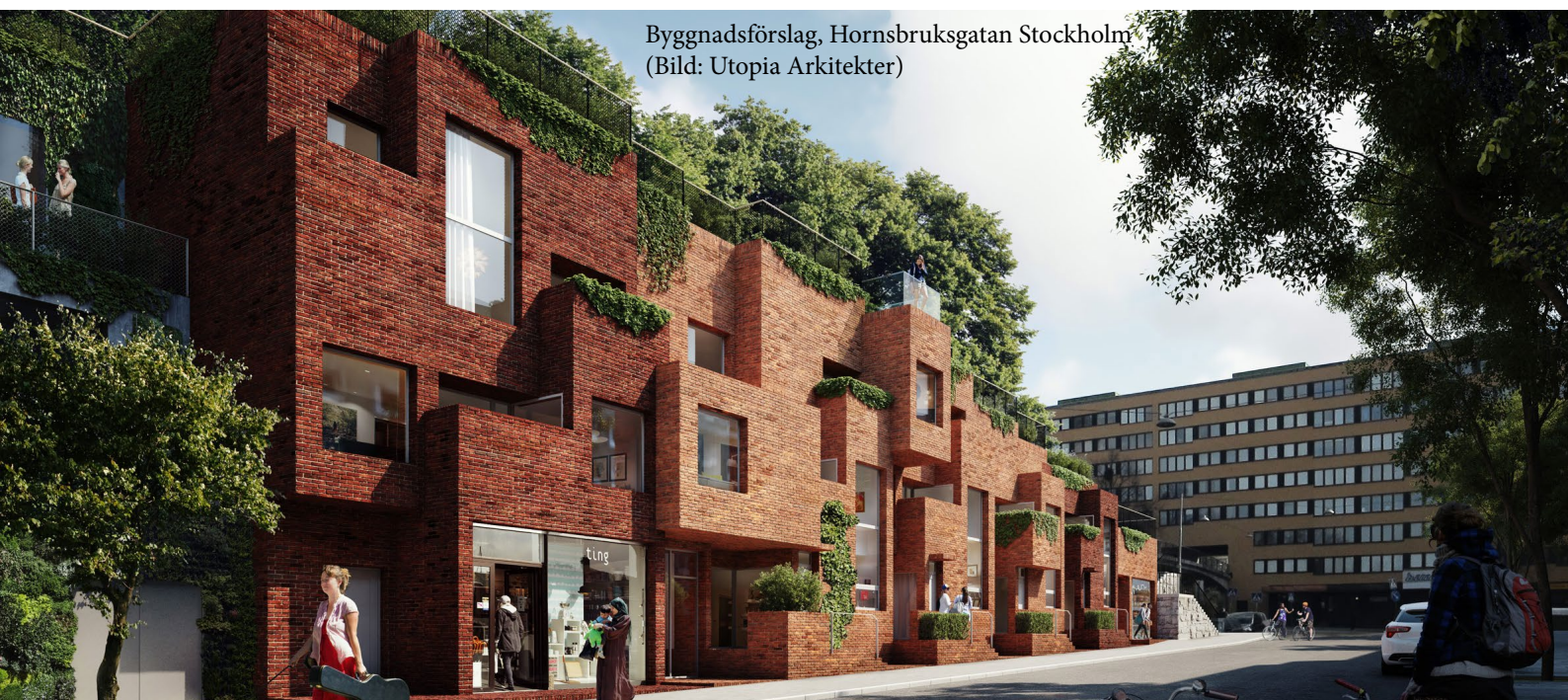
Byggnadsförslag, Hornsbruksgatan Stockholm (Bild: Utopia Arkitekter)

Höjdskillnader kan tas upp med pelare eller suterrängvåningar för att undvika onödig sprängning. En suterränglösning gör att byggnaden på ett naturligt sätt möter topografins olika nivåer.