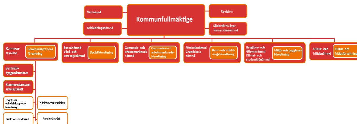
Figur 1 Organisationskiss Huddinge kommun