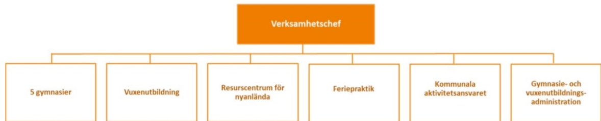
Figur 3 Organisationsskiss gymnasie- och vuxenutbildningsavdelning