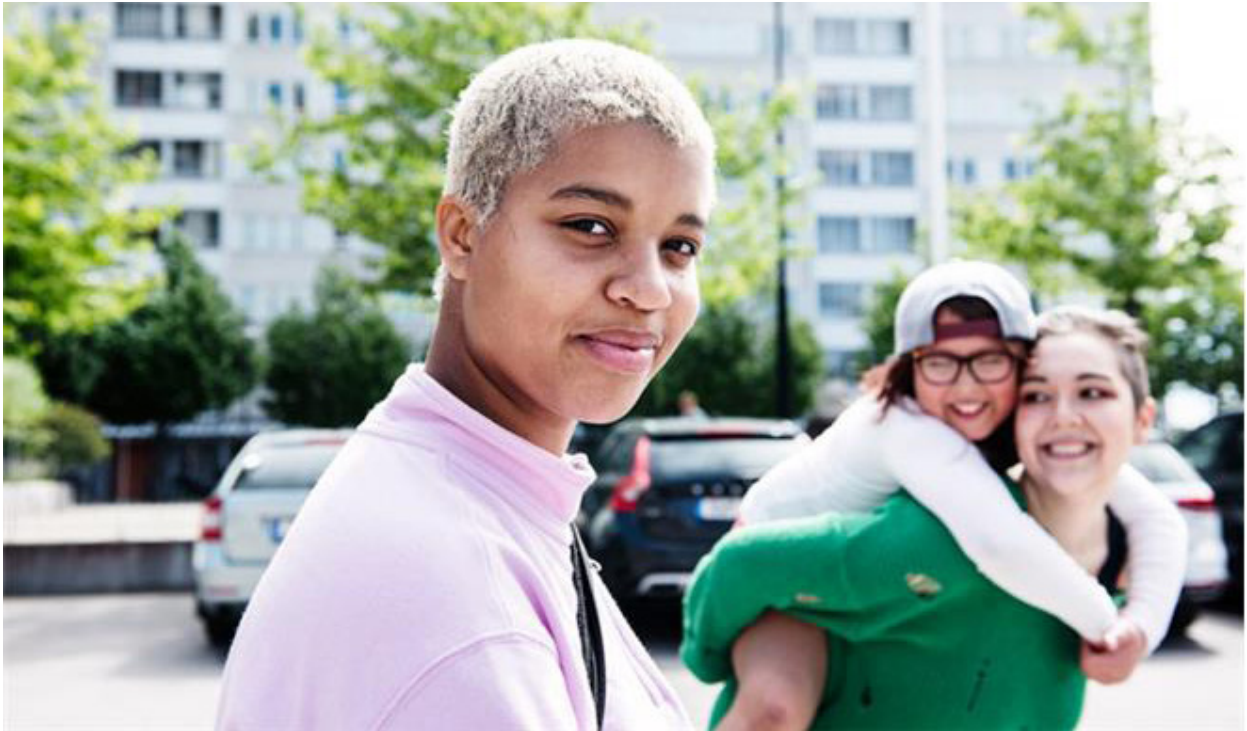
Bild: Tjejdag på fritidsgården Vårby Ungdom