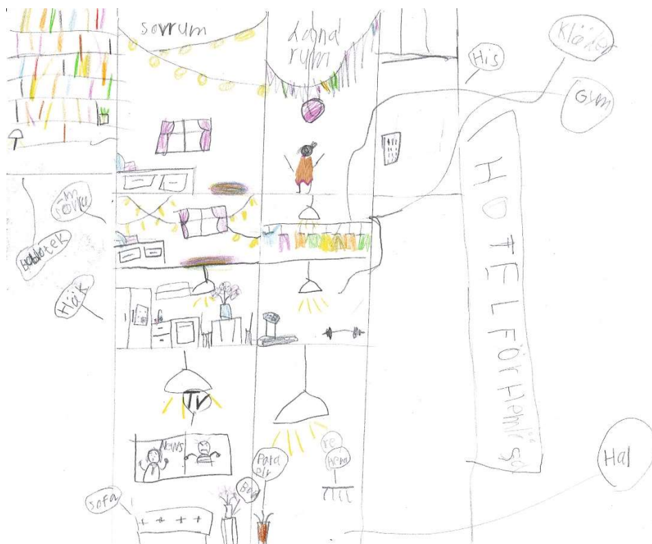
Boende för hemlösa

Klassernas yttranden går att läsa i sin helhet i den remissammanställning som bifogas samrådsredogörelsen.