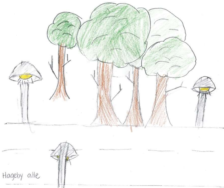
Belysning längs Hageby Allé

Barnen beskriver även att framtidens Huddinge är bättre upplyst om kvällarna och kommunen år 2050 har ordnat med boende för hemlösa där det går att få hjälp med utbildning och jobb så att alla ska må bra.