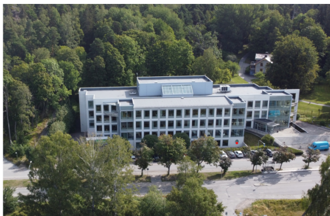
Foto över kontorsbyggnad (Spendrups tidigare huvudkontor) som föreslås omvandlas till skolbyggnad.

Förvaltningen ställde sig positiv till att skolan föreslås bli en F-9 skola med cirka 600 skolplatser. I planförslaget beskrevs hur den nya skolan kommer att ta plats i Spendrups gamla huvudkontor. Förvaltningen ställde sig positiv till att en befintlig lokal byggs om för skoländamål och att det blir en sammanhållen och funktionell skyddad utemiljö med goda dagsljusförhållanden och en skolgård utan korsande gång- och cykelvägar.