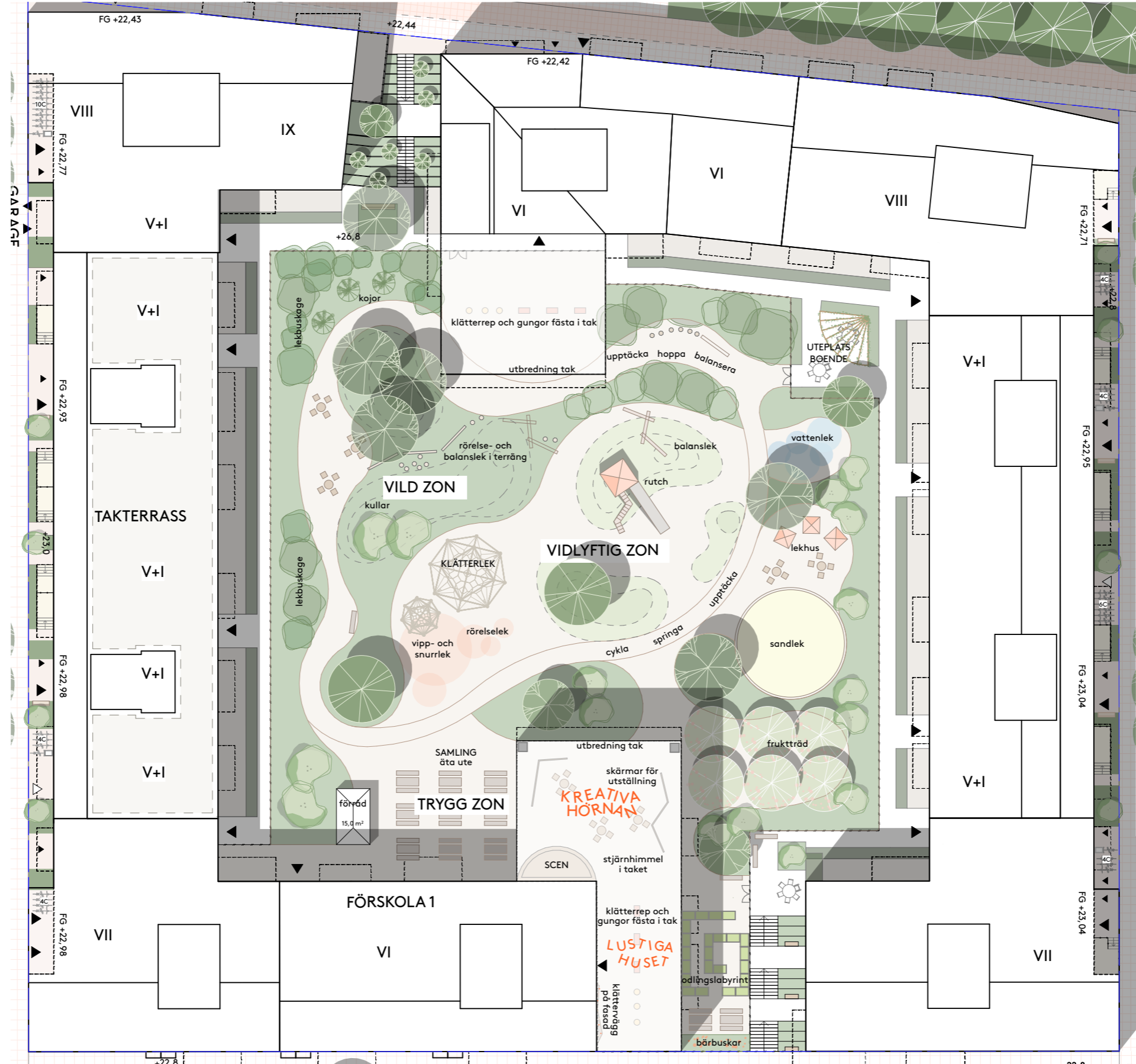
Illustrationsplan förskolegård KV2