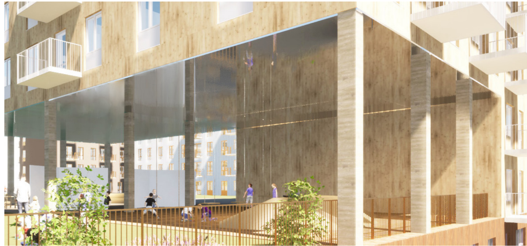
En mindre del av gården utförs väderskyddad under tak. Här skapas en väderskyddad plats för exempelvis kreativa aktiviteter.

Denna yta kompletterar den övriga gården på ett flertal sätt och erbjuder: - Vädskydd som möjliggör utevistelse vid regn, både gällande aktiviteter och utvila för yngre barn. - En skyddad plats för pedagogik och kreativa aktiviteter som att måla, pyssla och läsa. - Taket kan nyttjas till att bidra i leken, exempelvis genom målning, speglar och belysning. - Byggnaden kan användas för att integrera lekutrustning på olika sätt, så som klätterlek, spel, scen osv.