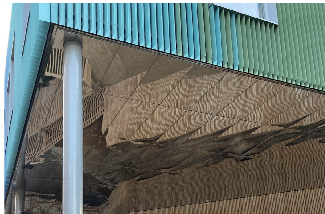
Taken kan exempelvis beklädas med speglar, lekfulla målningar eller ha integrerad belysning