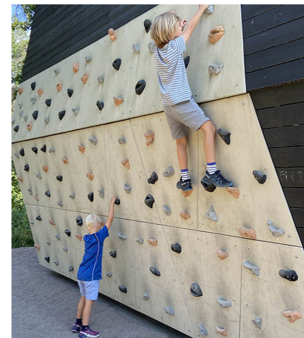
Tak och väggar kan nyttjas till att fästa lekutrustning