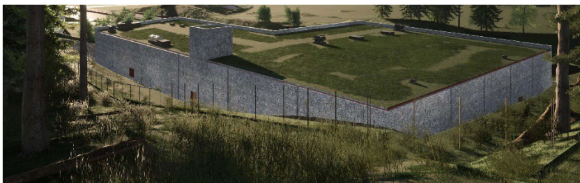
Figur 2: Illustration från Trafikverkets gestaltungsprogram

Byggnaderna placeras på en sprängd plåtå som omgivs av berg och vegetation. Gestaltningen av de tekniska anläggningarna ska anpassa sig till den omgivande naturen. Materialval ska vara tegel, trä eller sten. Färgsättningen av fasaden behöver följa naturens färger, varför kulörer som liknar skog och berg bör väljas. Vidare planeras byggnaden att uppföras med ett platt tak. Det platta taket planeras att följa den omgivande naturens vågräta linjer. Taket ska uppföras med vegetation för att byggnaden ytterligare ska inordnas i naturen.