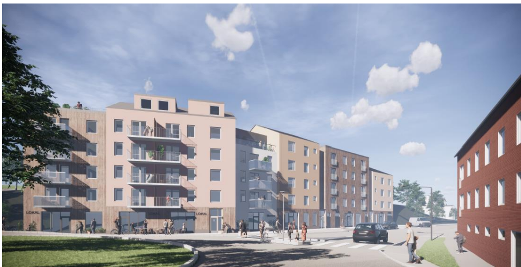
Illustrationen visar bebyggelsen sett från nordost