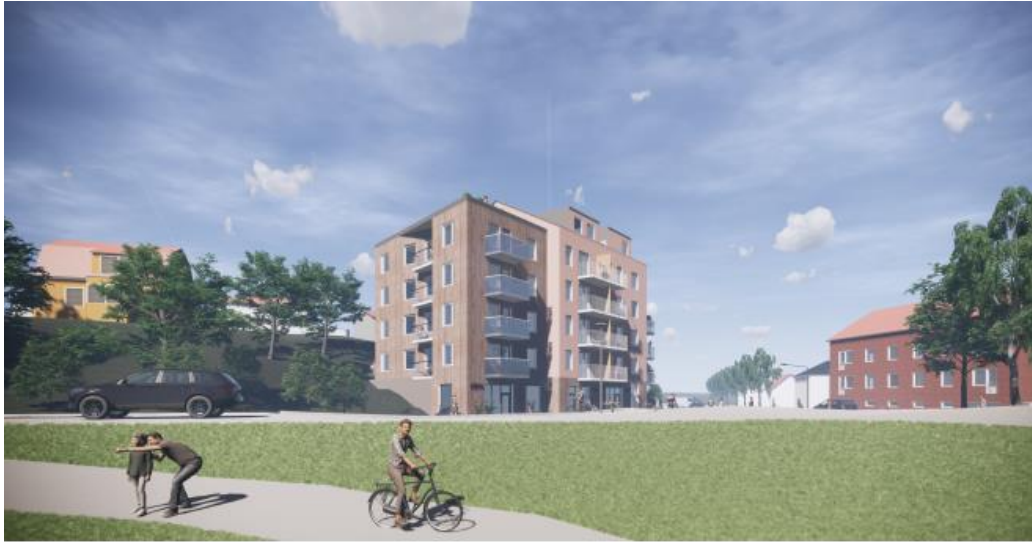
Illustrationen visar hur delar av kvarterets naturliga topografi och växtlighet förblir synliga från Stuvsta station efter detaljplanens genomförande

Genom att anordna all parkering i garage i enlighet med kommunens parkeringsprogram bevaras även den största delen av gården och sprängning undviks, vilket skulle annars vara aktuellt vid markparkering.