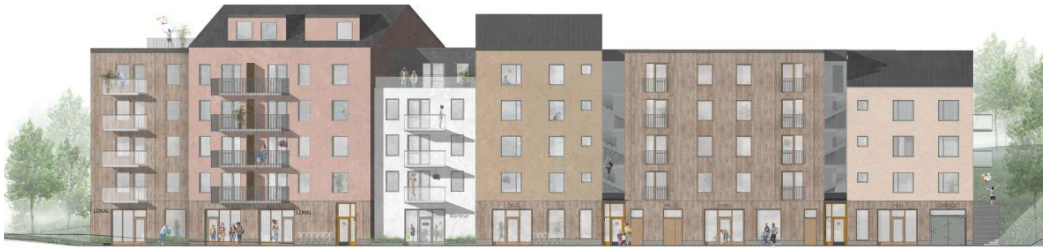
Illustrationen visar fasad mot norr