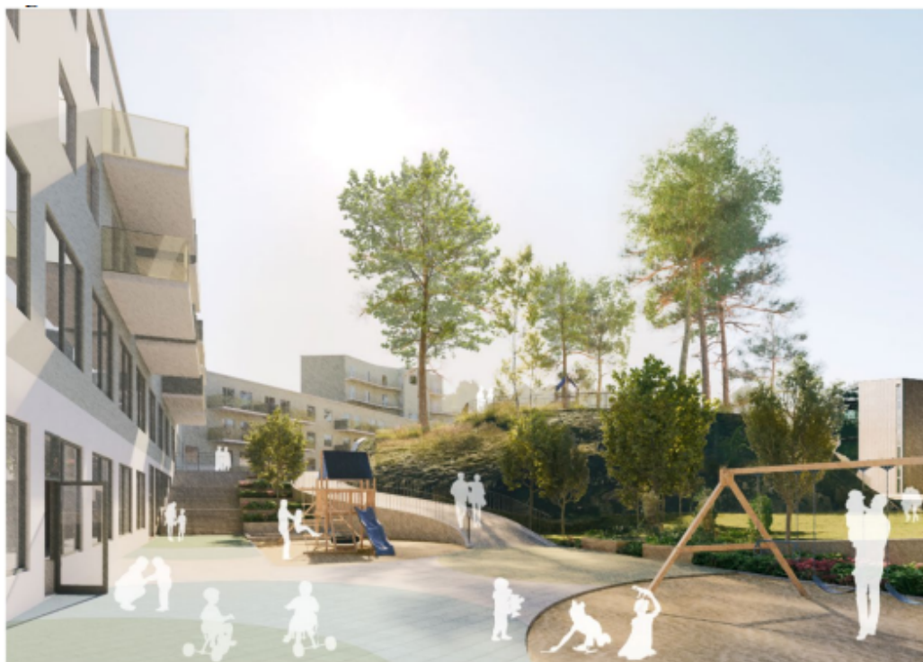
Kvarter C, vy över del av förskolegården.

Kvarteret försörjs från en ny gata som förläggs ut mot Huddingevägen. Här ordnas några angöringsplatser och handikapparkeringsplatser samt inlastning för förskolan och plats för sophämtning. Den nya gatan planeras för att på sikt kunna förbindas med lokalgatan som löper längs Biblioteksparken och det eventuellt framtida torget som redovisats i det parallella uppdraget. Byggnaderna varierar mellan fyra till åtta våningar med lägre delar mot gårdssidan. Totalt omfattar kvarteret ca 200 lägenheter.