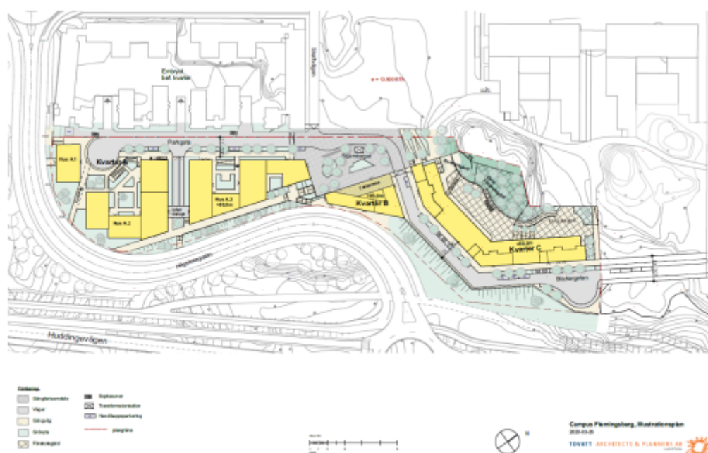
Situationsplan över tillkommande bostäder och förskola.

Kommunen bedömer att ett genomförande av planförslaget inte kan antas medföra en betydande miljöpåverkan och att en strategisk miljöbedömning därför inte är nödvändig. Länsstyrelsen bedömer att en betydande miljöpåverkan, orsakat av detaljplanens genomförande, inte går att utesluta. Kommunen delar inte länsstyrelsens ställningstagande och har motiverat vidare varför detaljplanens genomförande inte kan anses medföra en betydande miljöpåverkan. Detta är främst kopplat till biologisk mångfald för djur – växter. Påtalade värden ligger i de flesta fall utanför planområdet och berörs inte av aktuell detaljplan. De värden som berörs av planförslaget, exempelvis kandelabersvamp och blåsippan, där bedömer Huddinge kommun att förlusten lokalt inte bedöms leda till en så stor påverkan på arten som helhet att det kan klassas som betydande påverkan. I planarbetet har utvecklingen av campus hanterats i ett större perspektiv. Tidigt i processen togs det fram parallella uppdrag där tre arkitektkontor studerade Campus Flemingsberg i ett större perspektiv från Moas båge till Trafikplats Högsolan.