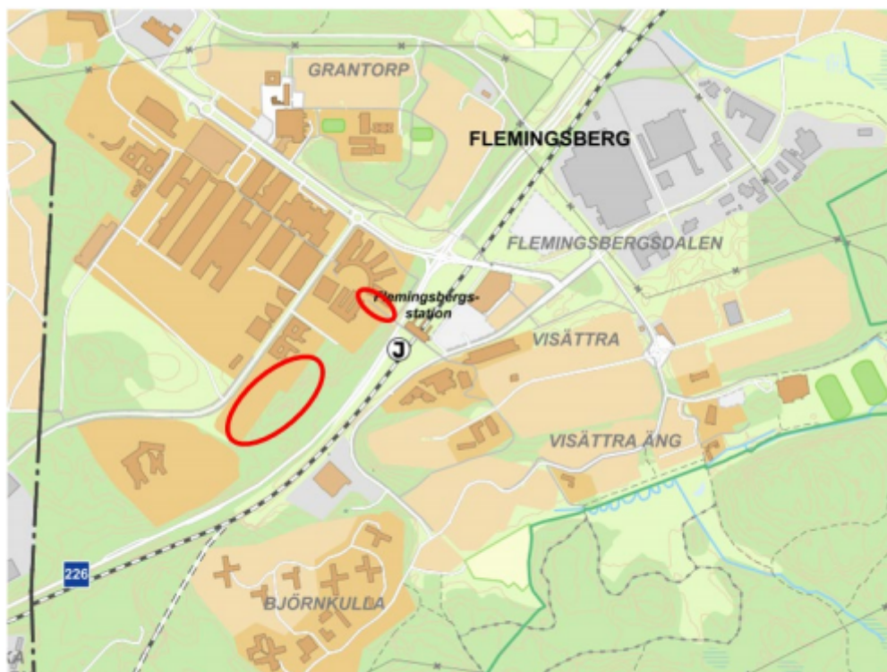
Planområdets ungefärliga läge inom Flemingsberg

Detaljplanen syftar till att skapa en ny bebyggelse som utvecklar campus Flemingsberg. Mängden bostäder i området innebär att det finns behov av att etablera en förskola i närområdet. På grund av ökade flöden från pendeltågstrafiken så behöver även befintligt rulltrappshus i Flemingsberg utvecklas med fler hissar. I och med denna plan möjliggörs ca 600 nya student- och forskarbostäder, samt en förskola och lokaler i anslutning till det torg som skapas.