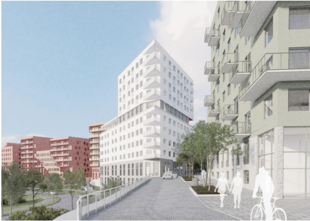
Kvarter A, och B sett från kvarter C

Kvarter C är uppdelat i två byggnadskroppar med liknande uttryck, vinklade huskroppar som följer kullens höjdkurvor. Mellan husvolymerna ligger en vändplats. Där finns en trappa som förbinder gatu- och gårdssidan. Tomten är mycket kuperad och både fyllning och sprängning kommer bli aktuellt för att skapa utrymme för byggnader och gård. Byggnaderna ligger delvis i souterräng. Kvarteret försörjs från en ny lokalgata som förläggs ut mot Huddingevägen. Här ordnas några angöringsplatser, handikapparkeringsplatser och plats för sophämtning. Byggnaderna varierar mellan fyra till åtta våningar med lägre delar mot gårdssidan. Totalt omfattar kvarteret cirka 200 lägenheter.