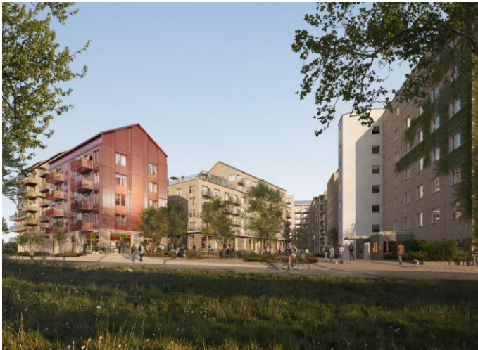
Vy mot kvarteret ifrån Huddinge stationsväg. Befintliga Tingshuset till höger i bild.