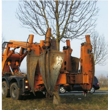
En större trädflytt-maskin.

Flytt av större etablerade träd: diket med avskurna grövre rötter och nya adventiv-(fin-)rötter. Maskin för omplantering.