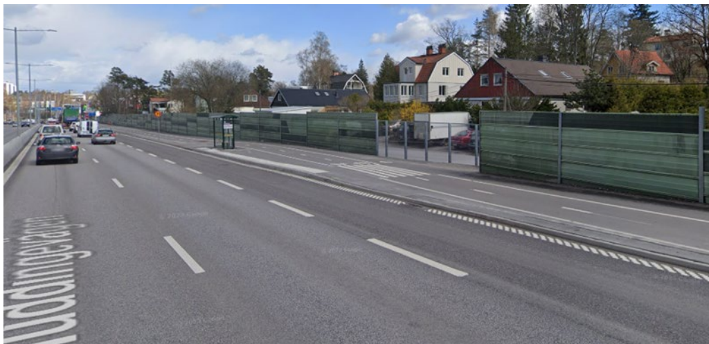
Bullerplanket som Trafikverket har byggt. Den genomskinliga delen är den nya delen. Tidigare gick det att svänga höger in till sidovägen från Huddingevägen om man körde söderifrån och åkte norrut.