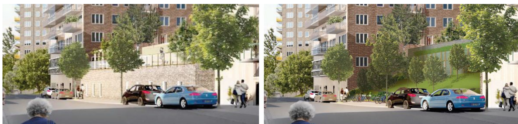
Figur 3. Till vänster visas en illustration av tidigare förslag och till höger visas nuvarande förslag med indragen garagebyggnad.