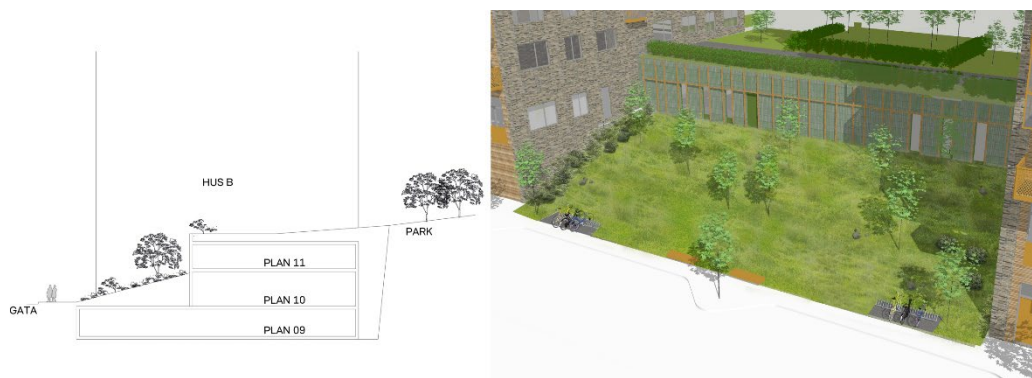
Figur 2: Sektion och illustration på indragen garagebyggnad mellan två av de tillkommande flerbostadshusen.