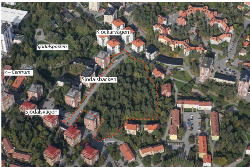
Figur 1: Översiktskarta med planområdet utpekad