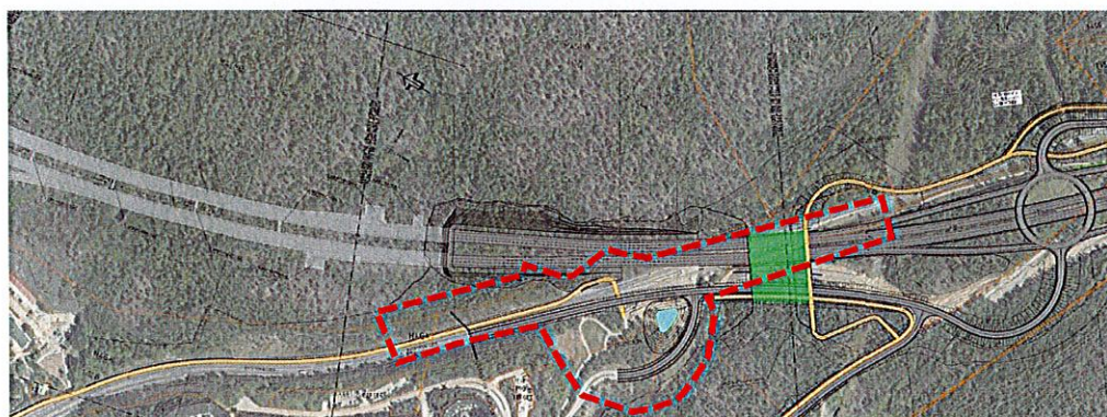
Figur 4: Illustration över Tvärförbindelse Södertörns utformning i Flottsbro. Området som upphävs markerat i rött

Trafikverket planerar att bygga en ny kapacitetsstark väg som kopplar ihop väg 73 (Nynäsvägen), väg 226 (Huddingevägen) och väg E4/E20. Projektet syftar till att förbättra resmöjligheterna i Södertörn. Trafikverket upprättar en vägplan som redovisar den nya vägens omfattning, påverkan och utformning. På grund av att gällande detaljplan reglerar vilken marknivå (plushöjd) som vägen ska ligga på så stämmer inte Tvärförbindelse Södertörn överens med planen. Detta innebär att kommunen behöver upphäva detaljplanen.