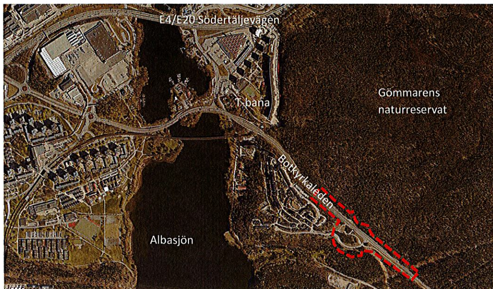
Figur 3: Flygfoto över berört område. Upphävandets avgränsning markerat i rött.