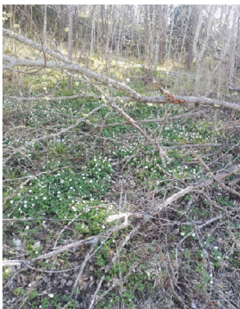
Vitsippor och snår i Sjötorpsparken

Det sammanlagda intrycket av en skog kan tala till flera av kroppens sinnen. Doften av kåda och barr en tallskog, prasslet av nedfallna löv på stigen, kvittret av fåglarna i ett buskage och en ensam hackspetts trummande. Natur i alla dess former har inspirerat konstnärer, diktare och författare i alla tider. De två namnförslagen bygger på begrepp som kan återfinnas i 1900-talets litteratur.