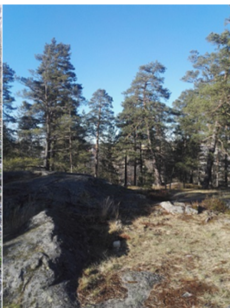
Höjdrygg i Sjötorpsparken