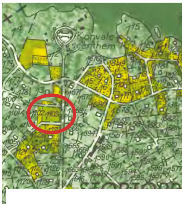
(Vänster) Utsnitt från Ekonomiska kartan, blad 1014g Södertörns villastad utgiven 1952.

Närliggande vägnamn är Vistvägen som ligger väster om parkområdet. Stortorpsvägen sträcker sig norrut. Säckgatan söder om parken var tidigare sammanlänkad med Passvägen , som före 50-talet hade sin genomfart här. Så småningom fick den avsnörda vägen ingå i adressområdet Printz väg (beslut i byggnadsnämnden 1970 §873).