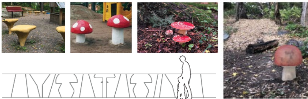
Bild 2. Konceptbilder från programhandlingen som visar staket/räcke med svampformer och lekskulpturer i form av träsvampar.

Lekplatsens utformning kommer att ha inslag av skog och svampar i form av staket, sittplatser, stockar, kojor och svampar i trä med mera. Staketet kommer att vara platsspecifikt med former av svampar. Svampar av trä i olika sorter och storlekar kommer att placeras i skogen.