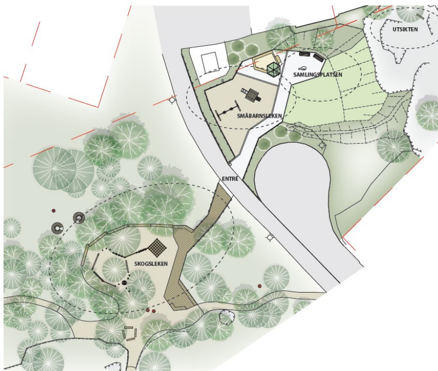
Bild 1. Lekplatsen placeras mellan två bostadskvarter i en skogsglänta som är en del av ett grönstråk som sträcker sig från naturreservatet och Sörskogens fotbollsplan i väster till Balingsnässkolan i öster. Bild och text är taget från PE Teknik och Landskaps programhandling för Balingsnäs lekplats, 2022-11-02.

Av den Häradsekonomiska kartan från 1901–1906 framgår det att området för där lekplatsen byggs tidigare har bestått av skog.