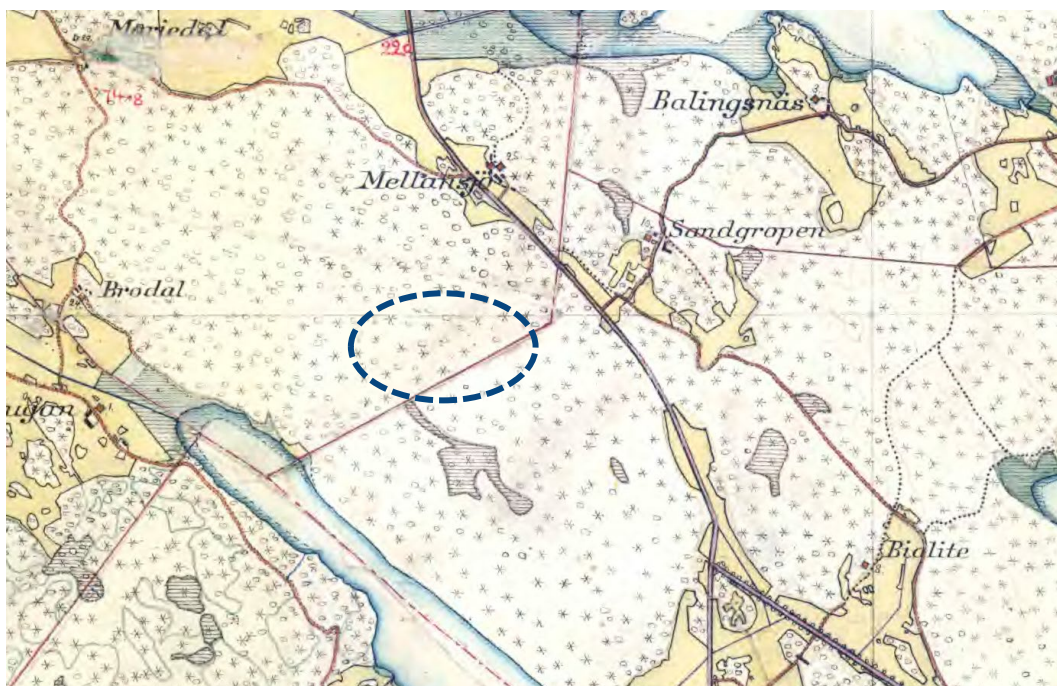
Karta 2. Området där lekplatsen uppförs är markerat med blå-streckad figur.

Av den Häradsekonomiska kartan från 1901–1906 framgår det att området för där lekplatsen byggs tidigare har bestått av skog.