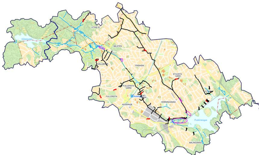
Figur 1. Trehörningens avrinningsområde

Nuvarande fosforhalt i sjön var 111 \mu\text{g/l} som treårsmedelvärde i augusti 2014. Mål för fosfor för att MKN ska kunna nås nedströms Trehörningen är 28 \mu\text{g/l} år 2021. Prognosen är dock att målet inte kommer att kunna nås till 2015.